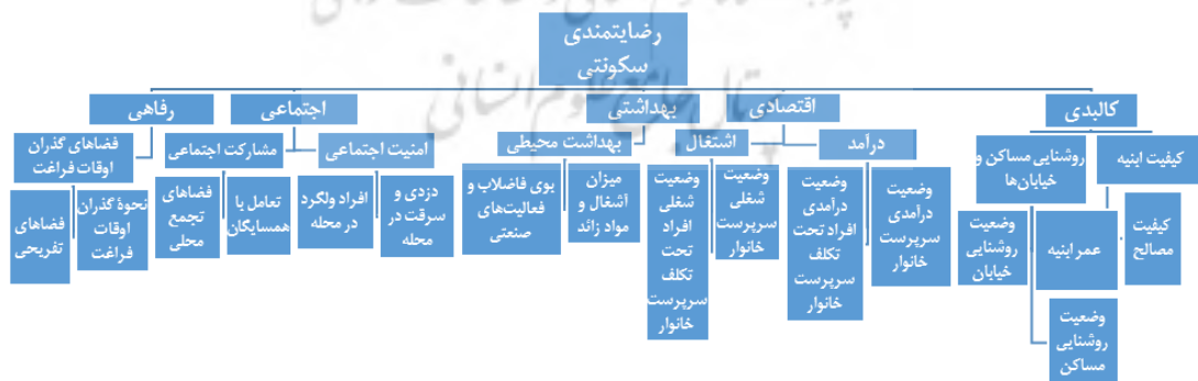
شکل ۱. نمودار رضایتمندی سکونتی و ابعاد آن

در جدول (۲)، از بین شاخص‌های گردآوری شده، شاخص‌هایی که بیشترین فراوانی را در بین پژوهشگران داشته‌اند به عنوان شاخص‌های اصلی در این پژوهش مورد استفاده قرار گرفته‌اند. باتوجه به نتایج جدول زیر از بین ۱۳ شاخص مطرح در میان ۱۱ پژوهش مختلف، ۹ شاخص کیفیت ابنیه، روشنایی مسکن و خیابان‌ها، درآمد، اشتغال، بهداشت محیطی، امنیت اجتماعی، مشارکت اجتماعی و فضاهای گذران اوقات فراغت به عنوان مهم‌ترین شاخص‌های رضایتمندی سکونتی در این پژوهش به کار رفته‌اند.