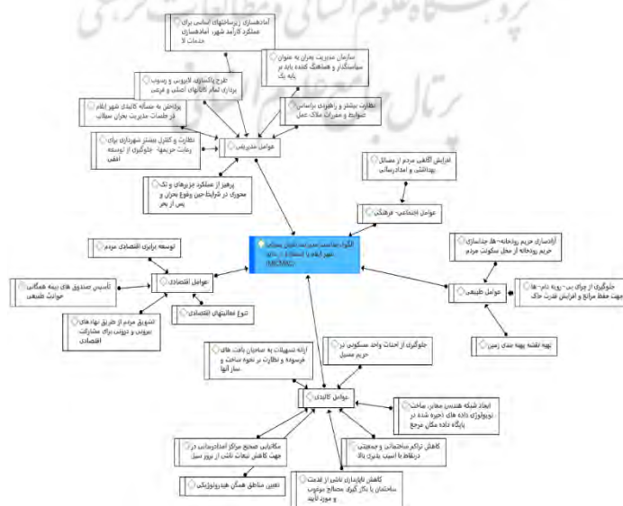
شکل ۳: الگوی مناسب مدیریت بحران سیلاب شهر ایلام

پس از استخراج عوامل کلیدی موثر بر وضعیت موجود مدیریت بحران سیلاب شهر ایلام (جدول ۹)، راهبردهای مربوط به مدیریت بحران سیلاب (جدول ۱۰) و الگوی مناسب مدیریت بحران سیلاب ترسیم شده است (شکل ۳).