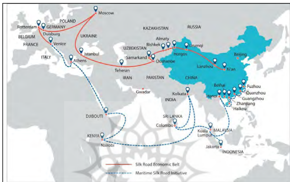
نقشه ۳. موقعیت ایران در جاده ابریشم

کبودراهنگ مزدقان (جرفادقان)، همدان و گردنه اسدآباد، کنگاور، صحنه، بیستون، فرمیس (کرمانشاه)، مازورستان، حلوان، قصر شیرین، جلولا، دسکره الملک (دستگرد ساسانی) و نهروان وارد بغداد می‌شده است و در کرانه رود فرات ادامه می‌یافت و به حدیثه می‌رسید و سپس در ساحل دریای مدیترانه به شهر انطاکیه می‌انجامید که آخرین مقصد راه زمینی بود. از حدود ۱۴ قرن پیش، در زمان امپراتور خاندان هان در شرق چین، یک مسیر دریایی که البته به طور رسمی بخشی از جاده ابریشم نبوده است، نیز مورد استفاده بوده است (Tian, 2016).