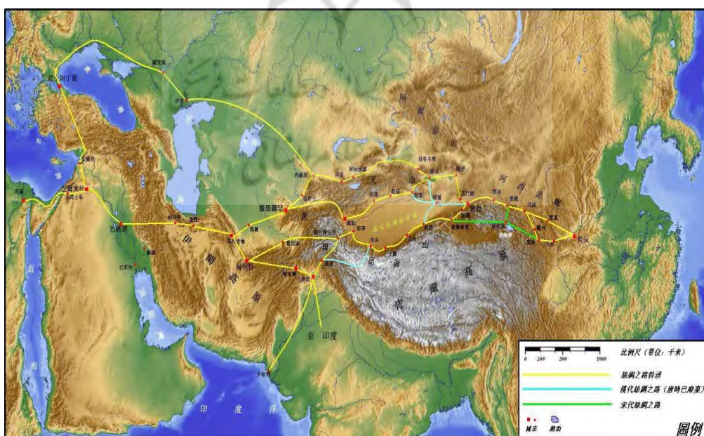
شکل ۱. موقعیت جاده ابریشم

جاده ابریشم (یا راه ابریشم)، راهی کاروان رو از دوران باستان تا حدود قرن هشتم/ چهاردهم، در دو قاره آسیا و اروپا (اوراسیا)، از چین تا مدیترانه، مورد استفاده تجارتي، زیارتي و سیاحتی بوده است. نام جاده ابریشم را اولین بار فردیناند فون ریشتهوفن (۱۸۳۳-۱۹۰۵)، جغرافیدان آلمانی، در میانه قرن نوزدهم به کار برد. ظاهراً سبب این نامگذاری، تجارت ابریشم به عنوان معروف ترین، سبک ترین و گرانبهاترین کالایی بوده که طی دهه‌ها قرن از طریق این جاده از چین به غرب می‌رفته است. مسیر اصلی این راه بین 30^{\circ} و 40^{\circ} عرض شمالی و 10^{\circ} تا 110^{\circ} طول شرقی امتداد داشته است. راه های فرعی دیگری نیز از هند و جنوب ایران به آن می‌پیوسته که به دلیل اهمیت نوع کالاهایی که در آن‌ها حمل می‌شده، نام های دیگری، مثل «راه ادویه»، به آن‌ها داده شده است. این راه ها نیز تا 20^{\circ} عرض شمالی امتداد می‌یافتند. طول تقریبی این راه را هشت هزار کیلومتر نوشته‌اند. این شاهراه از کشور چین شروع می‌شد، از فلات ایران می‌گذشت و پس از گذر از بین النهرین و شامات، به انطاکیه در کنار دریای مغرب (مدیترانه) می‌رسید (Cafiero and Wagner, 2017).