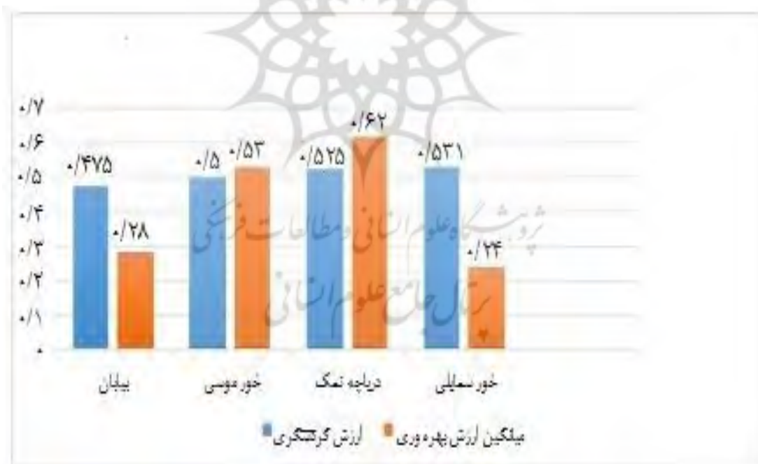
شکل ۳. نمودار میانگین ارزش گردشگری و ارزش بهره‌وری شهرستان ماهشهر منبع: (یافته‌ها نگارندگان)