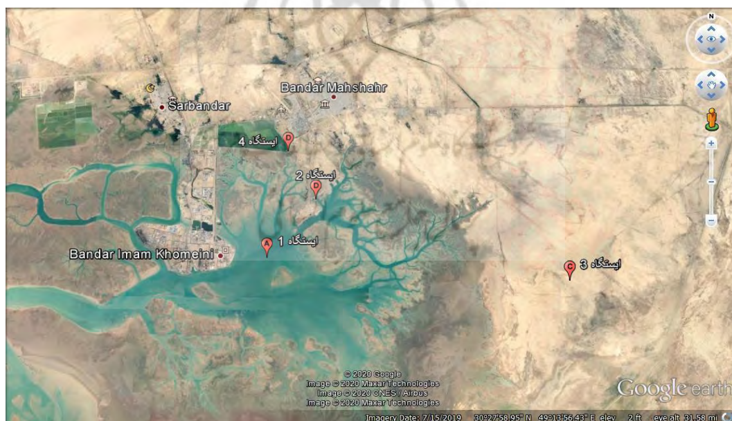
شکل ۱. نقشه موقعیت ۴ ایستگاه مورد مطالعه در منطقه مورد مطالعه.