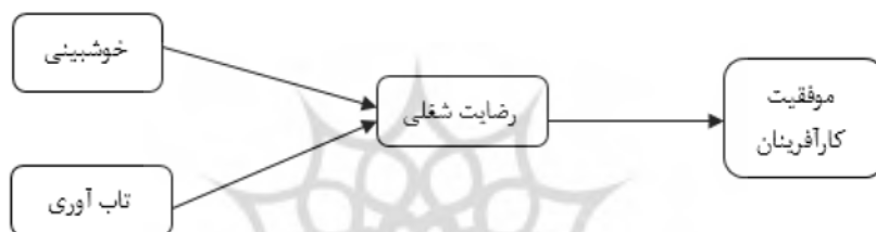
شکل ۲: مدل مفهومی پژوهش (Santoro et al., 2020 Zhang et al., 2020)

در شکل ۲، مدل مفهومی این پژوهش نشان داده شده است. این مدل تأثیر متغیرهای مستقل خوش‌بینی و تاب‌آوری در متغیر میانجی رضایت شغلی را بیان می‌کند و در نهایت رضایت شغلی به موفقیت کارآفرینان منجر می‌شود.