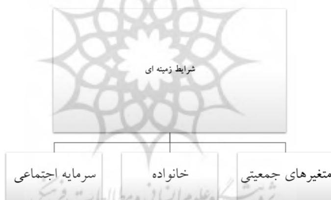
شکل ۴. شرایط زمینه‌ای

«من واقعا همه‌ی این مجموعه و تولیدی رو مدیون دوستانم هستم. اگه حمایت و همراهیشون نبود حتی یک ساعت ادامه پیدا نمی‌کرد. بچه‌ها هر کدوم یه گوشه کارو گرفتن و اینی شد که امروز میبینید»