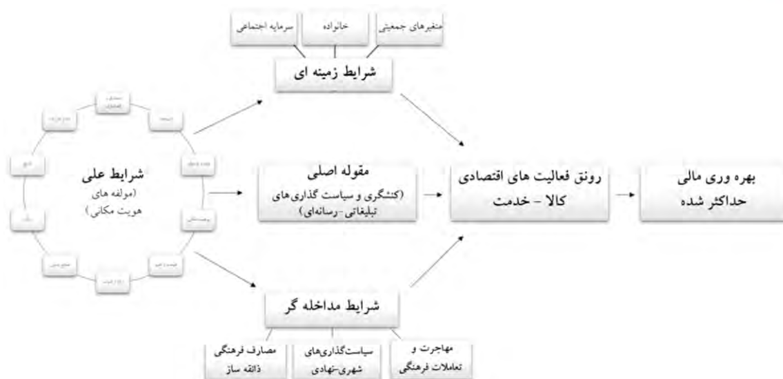
شکل ۶. مدل نهایی