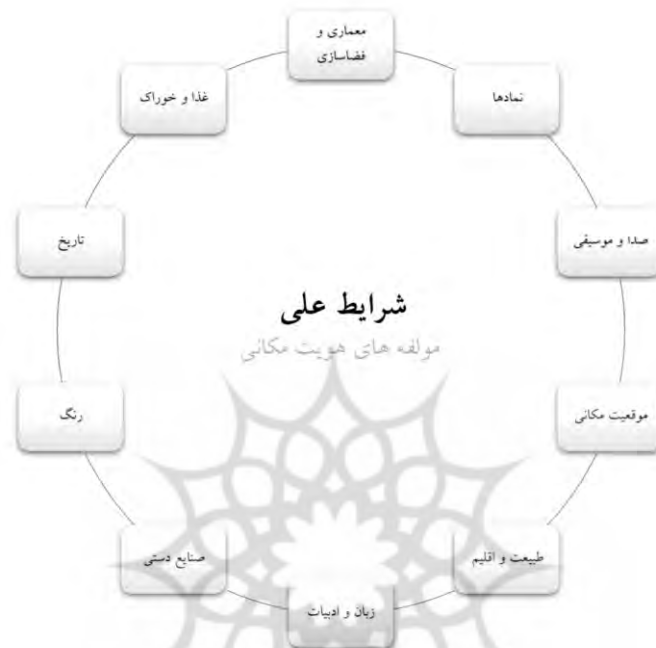
شکل ۳. مؤلفه‌های هویت مکانی

«شما به من بگید یک کلیپ یا فیلم کوتاه از طبیعت رشت چقدر ارزشمند و چه میزان می‌تونه مخاطب رو به حضور و بهره‌مندی از محیط رشت ترغیب کنه؟»