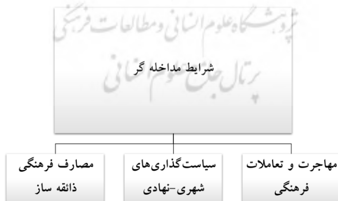
شکل ۵. شرایط مداخله‌گر

از دیگر متغیرهای مداخله‌گر در مسیر مورد اشاره تأثیر مصارف فرهنگی‌ای است که الهام‌بخش ذائقه‌ی مخاطبین می‌شوند. زندگی در عصر ارتباطات که محصولات رسانه‌ای گوناگون به‌طور دائم و در جای‌جای زندگی روزمره مورد مصرف قرار می‌گیرند ذهن مردم و جامعه را نسبت به هر ابژه‌ای در وضعیت مقایسه‌ای قرار می‌دهد. وضعیتی که هر کنشی را در این مسیر تحت تأثیر محصولات رسانه‌ای قرار می‌دهد و به اصطلاح آن‌ها را رسانه زده می‌کند. «این روزها هر روز بچه هامون دارن انواع تبلیغات و فیلم‌ها و کارتون‌های مختلف و متنوع می‌بینن. به نظر شما الان با اینا میشه از هویت و فرهنگ و تاریخ صحبت کرد؟»