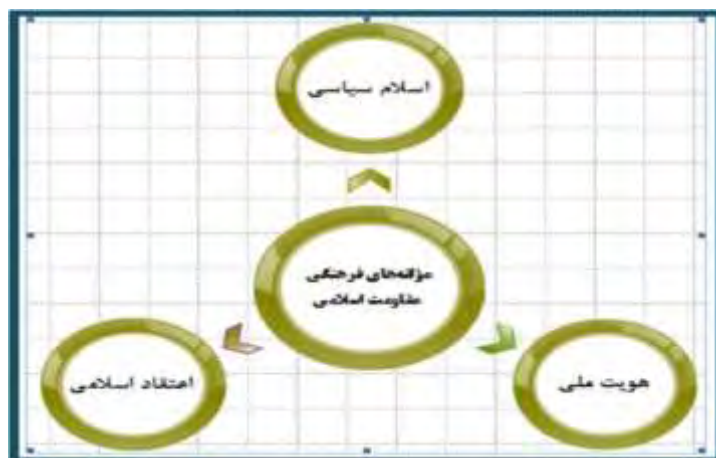
شکل ۱- مؤلفه‌های فرهنگی گفتمان مقاومت اسلامی