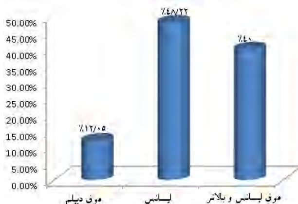
شکل ۳- نمودار ستونی توزیع درصد فراوانی تحصیلات در میان پاسخگويان

جداول ۲ و ۳ به ترتیب نتایج روایی بار عاملی گویه های پرسشنامه های مدیریت منابع انسانی پایدار و ابعاد فرهنگی گفتمان مقاومت اسلامی را نشان می دهند.