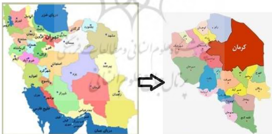
شکل ۲- موقعیت جغرافیایی شهرستان کرمان در استان کرمان (ترسیم: نگارنده، ۱۴۰۱)

در مورد قلمرو جغرافیایی پژوهش باید گفت؛ استان کرمان در جنوب شرقی ایران واقع شده است. از شمال با استان های خراسان و یزد، از جنوب با استان هرمزگان، از شرق با سیستان و بلوچستان و از غرب با استان فارس همسایه است. مساحت این استان حدود ۱۷۵۰ کیلومترمربع است و بین ۵۵ درجه و ۲۵ دقیقه تا ۳۲ درجه عرض شمالی و ۲۶ درجه و ۵۳ دقیقه تا ۲۹ درجه و ۵۹ دقیقه طول شرقی از نصف النهار گرینویچ قرار گرفته است. کرمان بعد از استان خراسان دومین استان پهناور کشور است و حدود ۱۱ درصد از خاک ایران را در بر گرفته است. لازم به ذکر است استان کرمان با دارا بودن ۶۶۰ اثر گردشگری ثبت ملی و ۷ اثر ثبت جهانی یکی از جذاب ترین مناطق برای گردشگران ملی و بین المللی است. و اخیراً با شهادت شهید حاج قاسم سلیمانی و وجود مزار ایشان در شهر کرمان جاذبه ای مهم ملی و بین المللی در حوزه گردشگری مذهبی شکل گرفته است. شهر کرمان که جامعه آماری هدف را در بر می گیرد با مساحت ۲۴۰ کیلومتری و جمعیت حدوداً ۵۳۷۰۰۰ نفره ۴ در مرکز استان قرار دارد. شکل (۲) موقعیت دقیق شهر را به نمایش می گذارد.