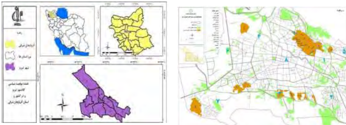
شکل ۱- موقعیت جغرافیایی کلانشهر تبریز در استان و کشور (ترسیم: نگارنده)