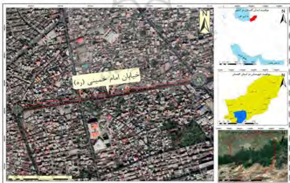
شکل ۱- قلمرو جغرافیایی خیابان امام خمینی (ره) شهر گرگان (ترسیم: نگارندگان)

شهرستان گرگان بین ۱۲/۹ درجه و ۵۴ دقیقه تا ۴۴/۹ درجه و ۵۴ دقیقه طول شرقی و ۳۰/۶ درجه و ۳۶ دقیقه تا ۵۸/۸ درجه و ۳۶ دقیقه عرض شمالی در بخش شمالی کشور واقع گردیده است. این شهرستان از جنوب به استان سمنان، از شمال به آق‌قلا، از شرق به علی‌آباد کتول و از غرب به کردکوی محدود است. مساحت شهرستان بالغ ۱۶۱۵/۸۱ کیلومتر مربع می‌باشد (معاونت برنامه ریزی استانداری گلستان، ۱۳۸۶)، شهرستان گرگان متشکل از ۲ بخش (مرکزی و بهاران)، ۳ شهر (گرگان، سرخنگلاته و جلین)، ۵ دهستان (استرآباد جنوبی، روشن آباد، انجیر آب، قرق و استرآباد شمالی)، ۹۷ آبادی دارای سکه و ۱۳ آبادی خالی از سکنه می‌باشد (سالنامه آماری استان گلستان، ۱۳۹۵). این شهر بر اساس آخرین سرشماری نفوس و مسکن مرکز آمار ایران در سال ۱۳۹۵ دارای ۳۵۰۶۷۶ نفر جمعیت بوده است. نرخ رشد جمعیت شهر گرگان در سال ۱۳۹۵، ۵/۰۲ است (سالنامه آماری شهرستان گرگان، ۱۳۹۵).