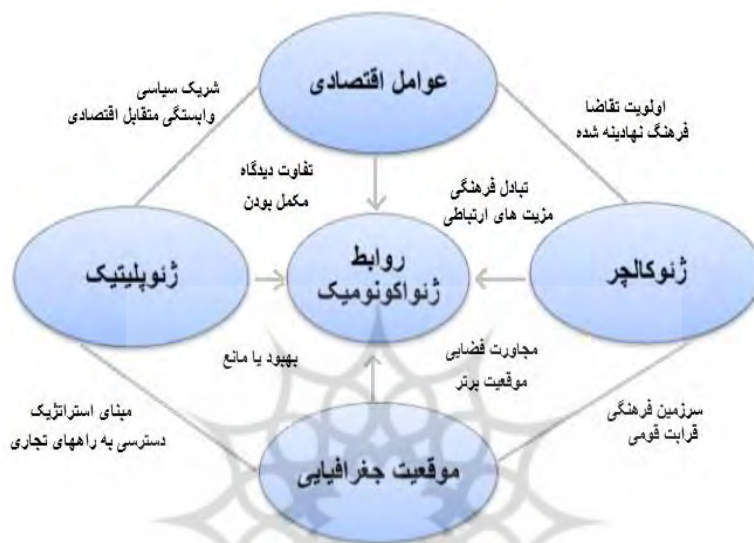
شکل ۱. روابط ژئواکونومیک

بین‌رشته‌ای است که عوامل ژئوپلیتیک، هوش اقتصادی، تحلیل استراتژیک و آینده‌نگری را پوشش می‌دهد (Csurgai, 2017:16). تجزیه و تحلیل روابط ژئواکونومیک شامل عوامل متعددی مانند سیاست، دیپلماسی، استراتژی، اقتصاد، منابع، جامعه، گروه قومی، فرهنگ، مکان و... است که به چهار دسته موقعیت جغرافیایی، عوامل اقتصادی، ژئوپلیتیک و ژئوکالچر از دیدگاه علل داخلی و خارجی مانند نمودار شماره (۱) طبقه‌بندی می‌شود (Wang, 2017:11).