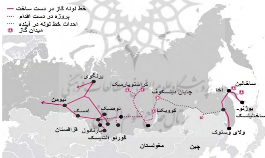
نقشه ۲. خطوط انتقال نفت گاز روسیه به بازارهای آسیای شرقی

در حال حاضر منابع گازی بزرگ سیبری غربی شناخته شده، کشف شده یا حتی توسعه یافته است و علاوه بر اینکه به مصرف داخلی می‌رسد به بازارهای اروپایی یا کشورهای مستقل مشترک المنافع نیز صادر می‌شود. پیش‌بینی می‌شود مصرف در این بازارها در درازمدت ثابت بماند یا رشد بسیار کمی داشته باشد. در مقابل انتظار می‌رود مصرف چین موتور اصلی رشد تقاضای جهانی گاز باشد (Galtsova & Huang, 2020:2). هم‌اینک، خط لوله گاز قدرت سیبری، گاز را از میدان چایان دینسکوف به مصرف‌کنندگان داخلی در شرق دور روسیه و چین می‌رساند (تصویر شماره ۲). طول این خط لوله ۳۰۰۰ کیلومتر است که از مناطق ایرکوتسک و آمور و جمهوری ساخا روسیه عبور می‌کند (https://gazprom.com.sakhalin2).