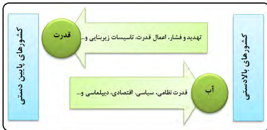
شکل ۲. رابطه دوسویه آب و قدرت از دیدگاه بازیگران فرادست - فرودست (Authors)