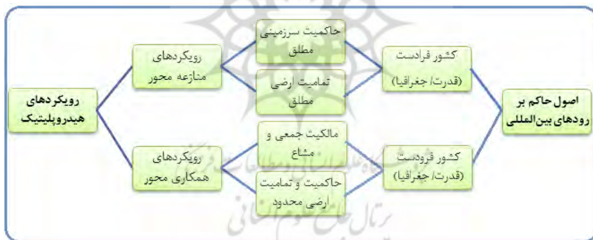
شکل ۳. نسبت رویکردهای هیدروپلیتیک و اصول حاکم بر رودهای بین‌المللی

مطابق یافته‌ها، استنباط بر این است که بین «موقعیت جغرافیایی» و «هیدروهمژمونی» کشورهای حوضه رودهای بین‌المللی با «اصول حاکم» بر این رودها، رابطه وجود دارد. به عبارتی، رویکردها و نگرش‌های هیدروپلیتیک کشورهای حوضه‌ی رودهای بین‌المللی که مولود و برخاسته از موقعیت جغرافیایی و هیدروهمژمونی این کشورها است، در گزینش اصول حاکم بر رودهای بین‌المللی مؤثر است. بر این اساس، کشورهای بالادستی (جغرافیایی) - که با نگاهی ابزاری، آب را به‌عنوان یک کالای اقتصادی جهت مبادله آن در قبال تأمین دیگر نیازها و اهدافشان می‌بینند- با استناد به اصل «حاکمیتی سرزمینی مطلق» آب را جزئی از منابع سرزمینی خود دانسته، در میزان و نحوه بهره‌برداری یا تخصیص آن به سایر کشورهای پایین‌دستی، خود را محق می‌دانند. در پایین‌دست، کشورهایی که از قدرت و موقعیت هیدروهمژمونی بالاتری نسبت به سایر کشورهای حوضه برخوردارند، با تأکید بر «اصل تمامیت ارضی مطلق»، این حق را برای خود مسلم می‌دانند، تا از دولت‌های بالادست همان مقدار آب را که در جریان طبیعی رودخانه است، مطالبه و تضمین نمایند. بدین ترتیب، ترکیبی از قدرت‌های مالی، اقتصادی، نظامی و دیپلماسی، در کنار اصل حقوقی «تمامیت ارضی مطلق»، ضعف جغرافیایی کشور پایین‌دستی را جبران نموده، نگرش و رویکردی سلطه‌جویانه را- نسبت به منابع آبی این رودها- برای کشور پایین‌دستی به همراه می‌آورد.