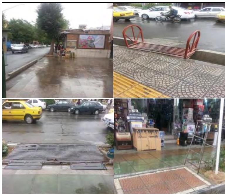
شکل ۴. فضاهای شهری نامناسب برای سالمندان در خیابان ملت شهرکرد