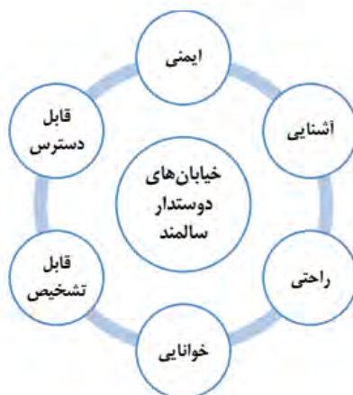
شکل ۱. مؤلفه‌های اصلی خیابان‌های دوستدار سالمند

در این راستا خیابان به عنوان یکی از مهم‌ترین اشکال فضاهای عمومی شهری و در جهت تحقق رویکرد شهر دوستدار سالمند، مورد توجه بسیاری از صاحب‌نظران قرار گرفته است. خیابان‌های شهری جزء برجسته‌ای از محیط‌های شهری هستند که امکان حرکت را فراهم کرده، محله‌ها را مشخص نموده و فضاهای عمومی را برای مشارکت اجتماعی فراهم می‌کنند (Xiong et al., 2020: 2). کیفیت خوب فضای خیابان برای سلامت جسمی و روانی سالمندان مفید است (Yeh, 2018: 75). افراد سالمندی که با فضای خیابان مطلوب و با کیفیت زندگی می‌کنند، قادر به انجام فعالیت‌های بیشتر و توسعه شبکه‌های اجتماعی هستند (Du, 2022: 2)؛ بنابراین فضای خیابان و برخی از فضاهای عمومی متصل به آن تأثیر بسزایی بر سلامت سالمندان دارد (Meng et al, 2020: 4) ولی مسئله مهم‌تر این است که از دیدگاه صاحب‌نظرانی همچون برتون میچل (۲۰۰۶) فضای خیابان در راستای پاسخگویی به نیازهای سالمندان باید دارای یک سری الزامات و عناصر معقول و ضروری باشند. آنها نشان می‌دهند که شش اصل کلیدی در طراحی خیابان‌ها وجود دارد، که عبارتند از: آشنایی، خوانایی، متمایز بودن (قابل تشخیص)، در دسترس، راحتی و ایمنی (شکل ۱).