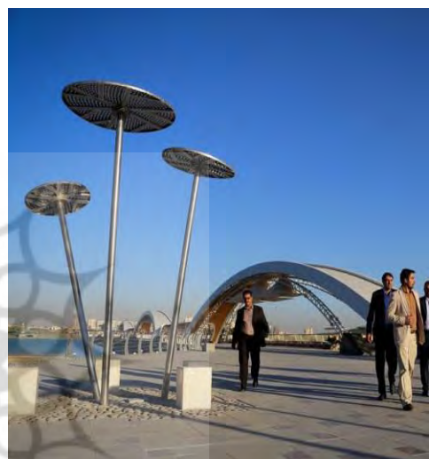
شکل ۴. وضعیت میلمان‌ها و نورپردازی شبانه در مجموعه تفریحی دریاچه شهدای خلیج فارس

اکولوژیک و معماری ایرانی اسلامی، به‌کارگیری روش‌های سالم و کارایی پاکسازی آب دریاچه جهت تهویه مطبوع هوا؛ به‌کارگیری روش‌های سالم و کارایی پاکسازی آب دریاچه جهت تهویه مطبوع هوا، ارائه خدمات گردشگری و تفریحی – آموزشی برای رده‌های سنی و گروه‌های هدف مختلف، نصب سپتیک‌ها و میلمان مناسب برای جمع‌آوری زباله و در نهایت کاشت درختان سایه‌انداز و استفاده از پوشش گیاهی متراکم جهت جداسازی فضای پارکینگ از فضای اصلی مجموعه.