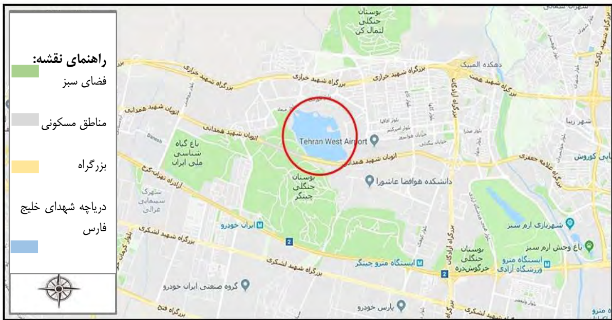
شکل ۳. موقعیت جغرافیایی دریاچه شهدای خلیج فارس واقع در منطقه ۲۲ تهران

روانی شهروندان اشاره کرد. همچنین مزیت‌های اقتصادی، اجتماعی پیش‌بینی شده برای این مجموعه ایجاد محیطی سالم جهت پرکردن اوقات فراغت؛ اشتغال‌زایی حاصل از خدمات جانبی، درآمدزایی ناشی از رونق صنعت گردشگری، ایجاد ارزش‌افزوده منطقه به خصوص در کاربری‌های اطراف دریاچه می‌باشند (وب‌سایت شهرداری منطقه ۲۲ تهران). لکن براساس مشاهدات میدانی صورت گرفته و مصاحبه با استفاده‌کنندگان از این فضا، کاستی‌هایی در ابعاد مختلف کالبدی، زیست‌محیطی، فرهنگی و امنیتی در این مجموعه وجود دارد که آن را از دستیابی به اهداف اولیه تأسیس دور خواهد ساخت. اتخاذ رویکرد سیستمی امنیت اکولوژیک و تکنیک گسترش عملکرد کیفیت (به‌عنوان روش پژوهش حاضر) در جهت انعکاس خواسته‌های مردمی و مشارکت آن‌ها پیشنهادی در جهت کاهش این معضلات خواهد بود.