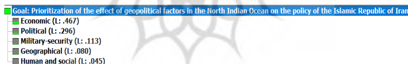
شکل (۶): نمودار درختی نتایج اولویت‌بندی تأثیر عوامل ژئوپلیتیکی شمال اقیانوس هند بر سیاست‌گذاری

همان‌طور که در جدول و شکل فوق نشان داده شده است، وزن شاخص اقتصادی ۰.۴۶۷، عامل سیاسی ۰.۲۹۶، عامل نظامی-امنیتی ۰.۱۱۳، عامل جغرافیایی ۰.۰۸۰، و عامل انسانی-اجتماعی ۰.۰۴۵ است. همچنین مقدار ناسازگاری ۰.۰۷ می‌باشد (که کم‌تر از ۰.۱۰ بوده و در سطح پذیرفته شده است). بنابراین میزان تاثیرگذاري و اولویت‌بندی عوامل ژئوپلیتیکی شمال اقیانوس هند بر تدوین سیاست‌گذاری جمهوری اسلامی ایران، مبین این مورد است که در حوزه شمال اقیانوس هند ۵ مؤلفه کلان ژئوپلیتیکی موثر به ترتیب اهمیت شامل مؤلفه اقتصادی با وزن نرمال شده ۱.۰۰۰ رتبه یک، مؤلفه سیاسی (داخلی و بین‌المللی) با وزن نرمال شده ۰.۶۳۴ رتبه