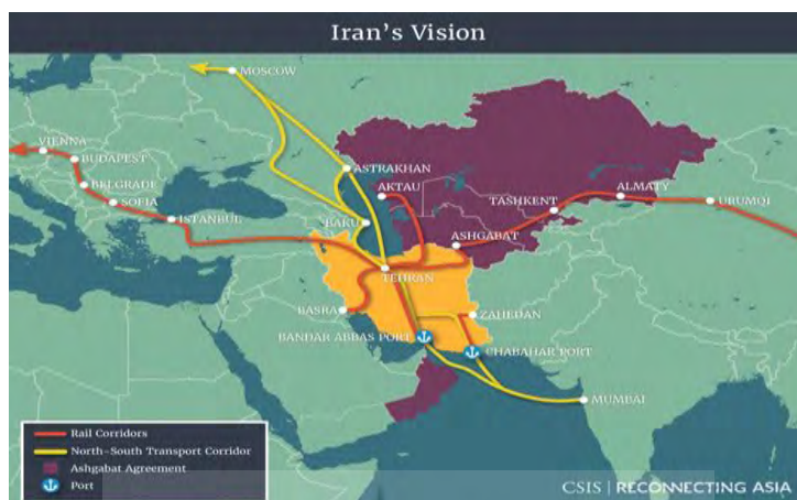
شکل (۱): نقشه خطوط مواصلاتی تجارت دریایی در اقیانوس هند