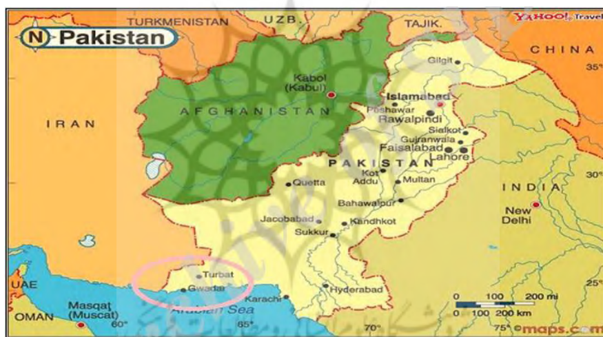
شکل (۴): نقشه بندر چابهار

از طرفی اهمیت راهبردی بندر چابهار با عبور از مانع پاکستان برای هند، مرکز وصل چند مسیر و کریدور شرق-غرب، جنوب-شمال، اروپا-قفقاز-آسیا است و می‌تواند در خدمت منافع ایران و هند باشد. کشور ایران به دلیل موقعیت ژئوپلیتیکی ویژه‌ای که در مسیر جنوب آسیا (هند، پاکستان، بنگلادش، میانمار، نپال و بوتان) و جنوب شرق آسیا (مالزی، اندونزی، ویتنام، کامبوج، تایلند و غیره) جهت صادرات انرژی و همچنین انتقال کالاهای این منطقه به سایر مناطق ژئوپلیتیکی جهان مانند آسیای مرکزی، قفقاز و اروپا دارد ناگزیر به تلاش جدی برای نقش‌آفرینی در دنیای ژئوپلیتیک نوین می‌باشد و در غیر این صورت از کاروان دگرگونی‌های ژئوپلیتیک جهانی باز خواهد ماند.