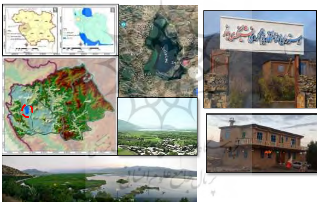
شکل (۲) موقعیت منطقه مورد مطالعه و نمونه اقامتگاه‌های بومگردی محور تالاب زریوار.

با توجه به جذابیت منطقه در راستای جذب سرمایه‌گذار به‌ویژه به‌واسطه هم‌جواری با مرز بین‌المللی باشماق و اقلیم کردستان عراق به‌عنوان یک بازار مهم اقتصادی و گردشگری کشور، این منطقه پرتوان گردشگری با توجه به سیاست‌گذاری انجام گرفته در حوزه گردشگری استان مبتنی بر توسعه بومگردی‌ها به‌صورت قارچ‌گونه شاهد افزایش اقامتگاه‌های بومگردی با وجود دارا بودن ضعف‌ها و چالش‌های اساسی در تمامی عناصر زنجیره فعالیت‌های گردشگری از جذب تا تجربه‌سازی و بازگشت گردشگران است و دید کمی به افزایش تعداد واحدهای بومگردی در این فضای گردشگری منطقه آینده‌روشنی را در ارتباط با اثربخشی این اقامتگاه‌ها ترسیم نمی‌کند.