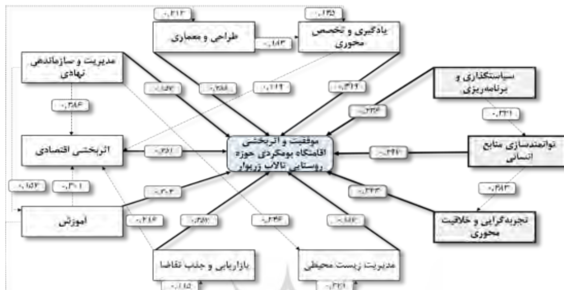
شکل (۴) مدل نهایی تحلیل مسیر و ارتباطات عوامل مؤثر بر توسعه و اثربخشی اقامتگاه بومگردی حوزه تالاب زریوار در بخش تخصصی. منبع: (یافته‌های پژوهش، ۱۴۰۱)

توسعه‌ای و عرصه عمومی فضای گردشگری منطقه و بومگردی‌ها و هم در عرصه جامعه محلی و فعالان عرصه گردشگری مدنظر است.