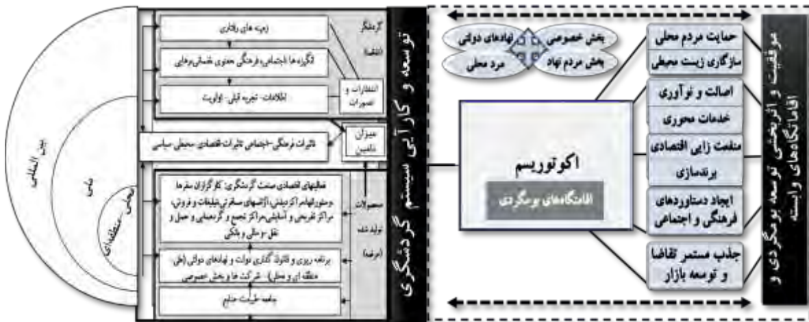
شکل (۱) مدل مفهومی پژوهش مبتنی بر اهمیت و ارتباط متقابل مدیریت سیستمی مقاصد گردشگری و توسعه بومگردی و

اقامتگاه‌های وابسته به آن در مقاصد گردشگری.