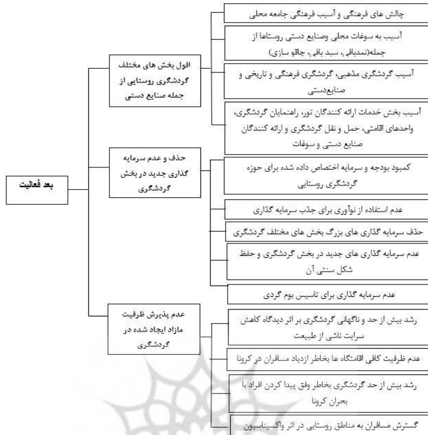
شکل ۲. مدل نهایی تحقیق

اولین موضوعی که به صورت مکرر در مرور و بازخوانی یادداشت‌های میدانی پژوهشگران به آن اشاره شده بود این بود که شیوع کرونا به تعطیلی اقامتگاه‌ها و جاذبه‌ها انجامید و در پی آن مشاغل و کسب‌وکارهای گردشگری با افت بسیار شدید مواجه شدند که در نتیجه به عدم استفاده و ناشناخته ماندن و از بین رفتن ظرفیت‌های انسانی و طبیعی و فرهنگی برخی روستاهای گردشگری منجر شد. در ابتدای همه‌گیری کرونا موارد یادشده شامل روستای سولقان نیز شد. در عین حال، به دلیل نزدیکی این روستا به شهر تهران و نیز وجود خانه‌های دوم ساکنان شهر تهران، شاهد ورود گردشگرانی از شهر تهران بوده‌ایم. اما فعالیت‌های گردشگری و ورود گردشگران به اماکن تفریحی متوقف شدند. پس از ورود و تزریق واکسن کرونا این روستا با حجم زیادی از ورود گردشگران مواجه شد. این اتفاق در عین اینکه باعث رونق مجدد کسب‌وکارهای گردشگری شد مشکلاتی برای طبیعت و محیط زیست منطقه به وجود آورد که در تحقیق به آن اشاره شد.