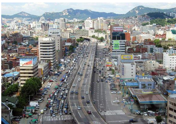
تصویر شماره ۱ و ۲: تجربه تبدیل «بزرگراه چئونگ» به یک فضای شهری سرزنده [۵۱]