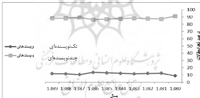
شکل ۱. درصد سهم تک‌نویسندگی و چندنویسندگی در نشریات فارسی حوزه فنی و مهندسی ایران طی سال‌های ۱۳۸۰ - ۱۳۸۹

با توجه به یافته‌های جدول ۳ سطح معناداری آزمون برابر ۰/۱۱۳ و بیشتر از ۰/۰۵ است، بنابراین بین متغیرهای مورد بررسی تفاوت معناداری وجود ندارد. پس با ۹۵ درصد اطمینان می‌توان گفت که طی سال‌های ۱۳۸۰ - ۱۳۸۹ از جنبه میانگین تعداد نویسندگان مقالات نشریات فارسی حوزه فنی و مهندسی ایران تفاوت معناداری وجود ندارد. به عبارتی در سال‌های مختلف میانگین تعداد نویسندگان به ازای هر مقاله تغییری نکرده است. با توجه به سؤال دیگر پژوهش، در این قسمت روند رشد تک‌نویسندگی و چندنویسندگی در مقالات فارسی نشریات علمی فنی و مهندسی ایران طی سال‌های ۱۳۸۰ - ۱۳۸۹ بررسی و برای پاسخ به این سؤال، مقالات به دو گروه تک‌نویسنده و چندنویسنده تقسیم و نمودار رشد آنها ترسیم شد.