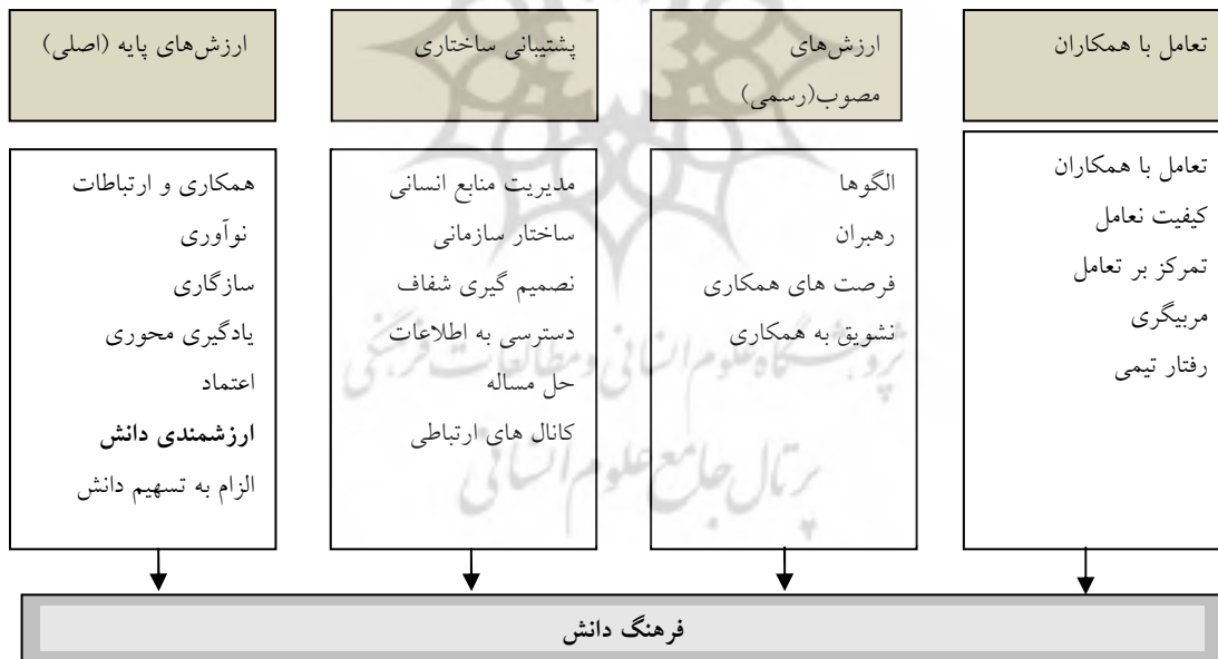
شکل ۳- توانمندسازهای فرهنگ دانش (دبوسکی، ۲۰۰۶)

توانمندسازهای فرهنگ دانش در چند سطح از سازمان، فعالیت می نمایند. هدف آنها همتراز نمودن ارزش های پایه و اساسی، ساختارهای سازمانی، سیستم ها و ساختارها و رفتارهای افراد برای ایجاد یک فرهنگ دانشی کارآ و موثر است. شکل ۳ به بررسی مولفه هایی که نقش به سزایی در ایجاد فرهنگ دانش دارند، می پردازد. در بررسی این توانمندسازها، شناخت تعامل آنها از اهمیت بسیاری برخوردار است. همانطور که ملاحظه می شود، چهار سطح و حوزه اساسی که جهت ایجاد و خلق فرهنگ دانشی کارآ، به طور مشارکتی نقش دارند، نمایش داده می شود (دبوسکی، ۲۰۰۶).