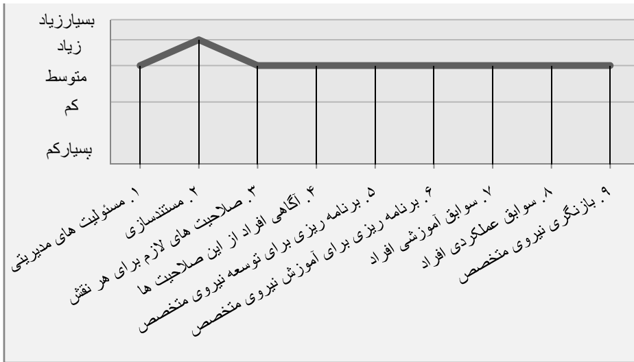
نمودار ۱. متغیرها در ملاک «سیستم مدیریتی»