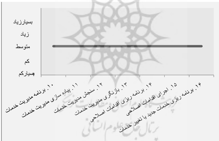
نمودار ۲. متغیرها در ملاک «برنامه ریزی و پیاده سازی مدیریت خدمات»