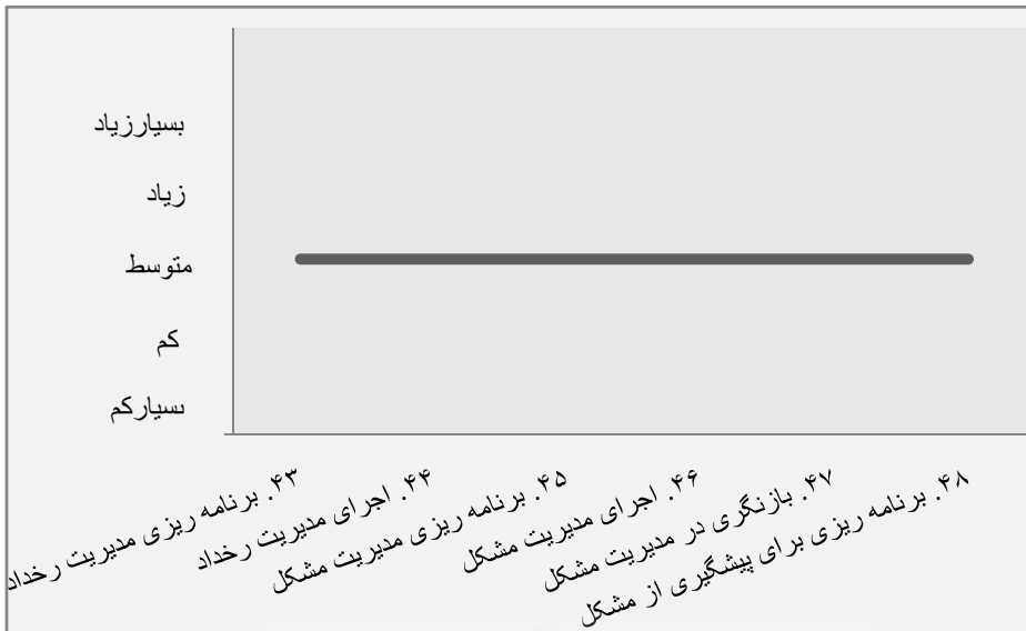
نمودار ۵. متغیرها در ملاک «فرایندهای راه‌حلی»