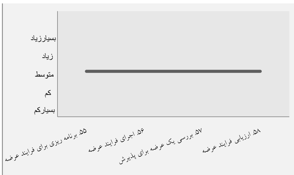
نمودار ۷. میانه متغیرها در ملاک «فرایند عرضه»