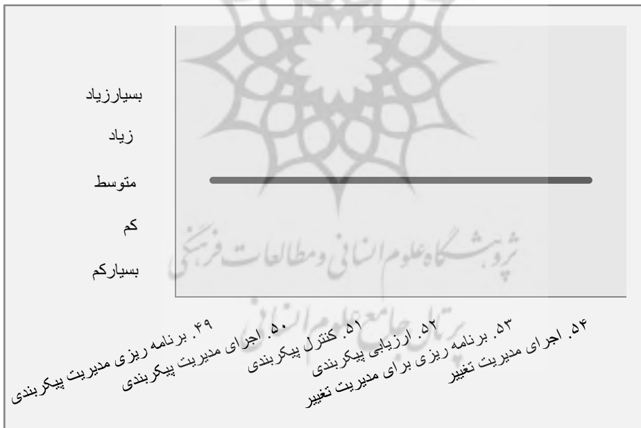
نمودار ۶. متغیرها در ملاک «فرایندهای کنترلی»