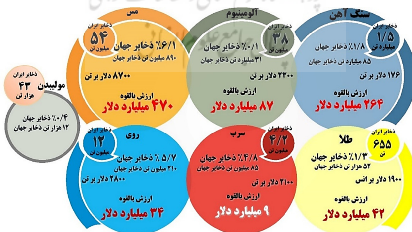
شکل ۱- وضعیت ذخایر معادن فلزات پایه در ایران

*ارزش بالقوه: حاصل ضرب میزان ذخایر در متوسط قیمت از ابتدای سال ۱۴۰۲.