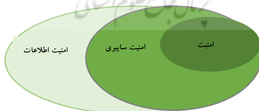
شکل ۲. ارتباط امنیت اطلاعات، امنیت سایبری و امنیت شبکه

امنیت اطلاعات برای پوشش سه هدف مجرمانه بودن، یکپارچگی و در دسترس بودن ایجاد شده است. داده‌ها، از جمله اطلاعات شخصی یا اطلاعات با ارزش بالا، باید مجرمانه نگه داشته شوند و مهم است که همه دسترسی‌های غیرمجاز مسدود شوند. با حرکت به سمت یکپارچگی، داده‌های ذخیره شده باید به ترتیب صحیح نگهداری شوند و از این‌رو، هرگونه تغییر نامنظم توسط یک شخص غیرمجاز باید فوراً بلاک شود. در نهایت، ضروری است که داده‌های ذخیره شده در هر زمان بتواند توسط پرسنل مجاز قابل دسترسی باشد. امنیت اطلاعات ابر مجموعه‌ای از موضوعات مختلف است که از یک منظر می‌توان آنرا در قالب امنیت سایبری، امنیت شبکه و سایر موضوعات مورد مطالعه قرار داد.