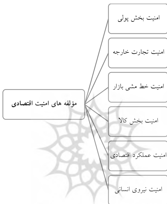
شکل شماره (۳) الگوی کلی سنجش امنیت اقتصادی

وظایف اقتصادی یک نظام اقتصادی ایجاد صلح اساساً به معنای احیاء، تداوم و توسعه نظام اقتصادی است. براساس مطالعات انجام شده در حوزه امنیت اقتصادی، اصلی‌ترین مؤلفه‌های امنیت اقتصادی را به شکل زیر می‌توان تقسیم‌بندی نمود.