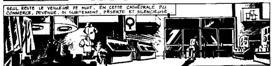
SEUL RESTE LE VEILLEUR DE NUIT, EN CETTE CATHÉDRALE DU COMMERCE, REVÊNU, SI SUBITEMENT, DÉSERT ET SILENCIEUX.