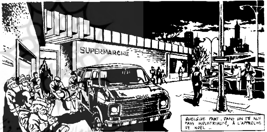
QUELQUE PART, DANS UN DE NOS PAYS INDUSTRIALISÉS, À L'APPROCHE DE NOËL ...

DÉPOSEZ-LES DANS LE COIN LES PÉCUNIAIRES S'EN CHARGERONT PÈS DEMAIN