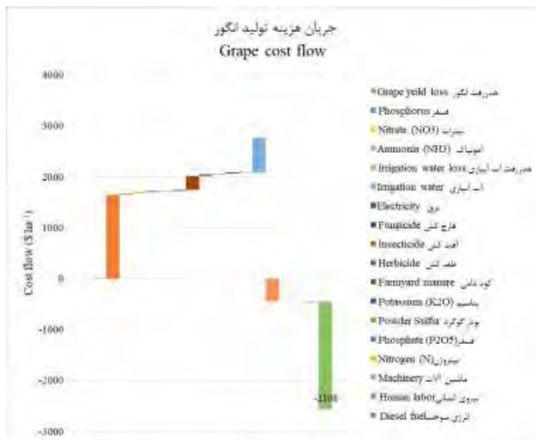
شکل ۳- جریان هزینه در تولید انگور Figure 3- Cost flow of grape production