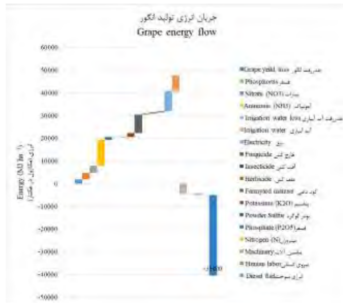
شکل ۲- جریان انرژی مثبت و منفی در تولید انگور