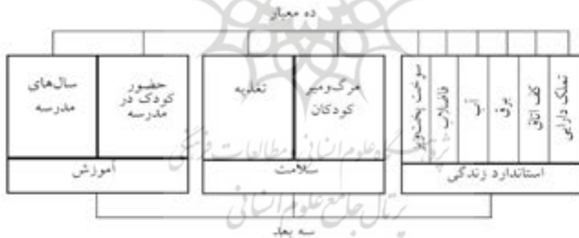
نمودار (۱): ابعاد و معیارهای فقر چندبعدی

- شاخص فقر چندبعدی به روش آلکایر و فوستر: شاخص فقر چندبعدی افراد فقیر را با استفاده از آستانه‌های محرومیت و فقر شناسایی می‌کند و شامل سه بعد سلامت، آموزش و استاندارد زندگی است و هر بعد شامل چند معیار است. ۸ معیار از بین ۱۰ معیار مطابق با اهداف توسعه هزاره هستند. نمودار (۱)، ابعاد و معیارهای شاخص فقر چندبعدی را نشان می‌دهد.