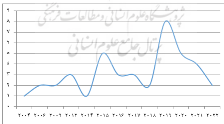
شکل ۳- مقالات وارد شده به مطالعه به تفکیک سال انتشار

از یک فرم گردآوری داده شامل قسمت‌های مشخصات نویسندگان، عنوان مقاله، سال انتشار مقاله، محل انجام مطالعه، هدف مطالعه، سال انجام مطالعه و مؤلفه‌های اصلی مورد بررسی شامل پنج حیطه اولویت‌بندی بیماری‌ها برای مراقبت، ساختار نظام مراقبت، وظایف اصلی نظام مراقبت، وظایف پشتیبان نظام مراقبت، و کیفیت مراقبت، برای استخراج داده‌ها استفاده شد. از روش تحلیل چارچوبی ریچی و اسپنسر برای تحلیل داده‌ها استفاده شد که شامل پنج مرحله آشنایی با