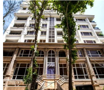
بام مهماندوست سال ساخت: ۱۳۸۷ مشخصات نما: سرستون ساده، فرم پنجره قوس دار ساده، طرح نوارهای افقی، بالکن، احجام هرمی شکل قوس، با نمای سنگ گرانیت و سیمان