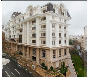
بام البرز سال ساخت: ۱۳۹۰ مشخصات نما: سرستون ساده، فرم پنجره قوس دار ساده، طرح نوارهای افقی، بالکن، احجام هرمی شکل قوس، احجام پیش آمده افقی، دارای ستوری و سرایی ورودی، با نمای سنگ گرانیت و سیمان