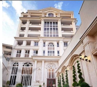
بام جمشیدیه سال ساخت: ۱۳۹۰ مشخصات نما: سرستون کورنتی، فرم پنجره قوس دار ساده، طرح نوارهای افقی، بالکن، احجام هرمی شکل قوس، نمای سنگ گرانیت و سیمان