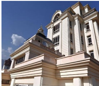
چناران پارک سال ساخت: ۱۳۹۰ مشخصات نما: سرستون کورنتی، فرم پنجره قوس دار ساده، طرح نوارهای افقی، بالکن، احجام هرمی شکل قوس، احجام پیشامده افقی، سرای ورودی، نمای سنگ گرانیت و سیمان