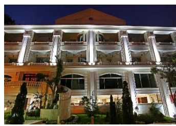
رز گاردن سال ساخت: ۱۳۸۹ مشخصات نما: فرم پنجره قوس دار ساده، دارای ستوری و سرایی ورودی، دارای نرده، با نمای سنگ گرانیت و سیمان