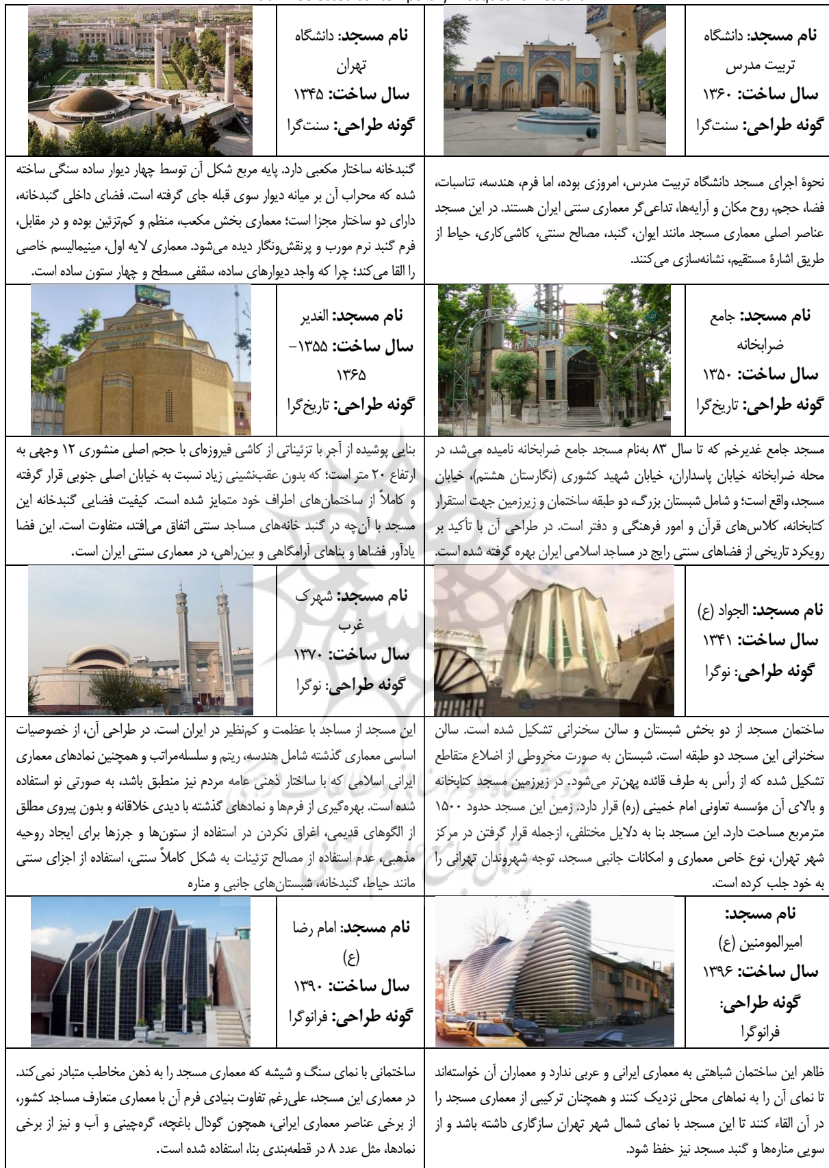
Tab. 1: Selected contemporary mosques for research