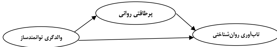
شکل ۱- مدل علی اثرات میانجی‌گر پژوهش

۲۰۱۹؛ سگکال و اُردمیر، ۲۰۱۹)، اما تأکید بر پرتاقتی روانی به‌مثابه یک میانجی‌گر، در رصد ظرفیت تفسیری شیوه‌ی والدگری توانمندساز در قلمروهای مختلف، کمتر مورد توجه قرار گرفته است (سگکال، ۲۰۱۹). بر