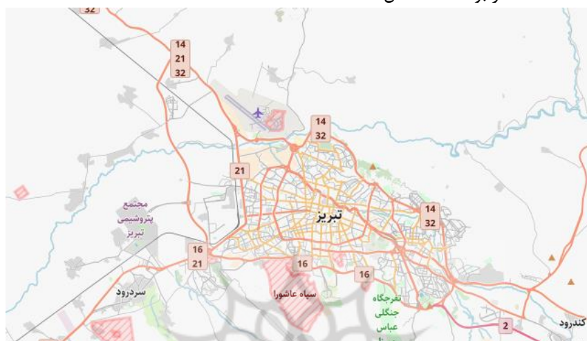
شکل (۱). موقعیت منطقه مورد مطالعه

محدوده مطالعاتی تحقیق حاضر شهر تبریز می‌باشد. کلان‌شهری در منطقه آذربایجان ایران و مرکز استان آذربایجان شرقی است. این شهر، بزرگ‌ترین قطب اقتصادی منطقه آذربایجان ایران و مرکز اداری، ارتباطی، بازرگانی، سیاسی، صنعتی، فرهنگی و نظامی این منطقه شناخته می‌شود. کلان‌شهر تبریز ۲۴۴/۵۱ کیلومترمربع وسعت دارد و جمعیت آن نیز در سال ۱۳۹۵ خورشیدی بالغ بر ۱۵۹۳۳۷۳ نفر بوده است شکل (۱).