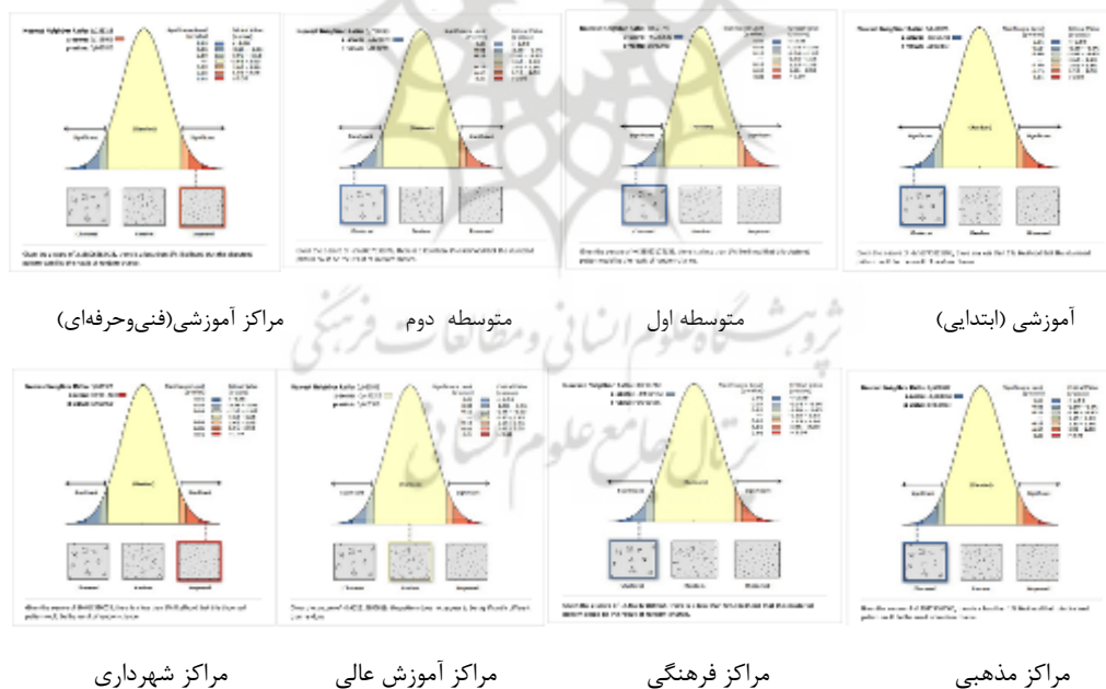
شکل (۲). نوع الگوی توزیع کاربری های یادگیرنده