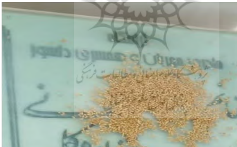
تصویر شماره ۲- ریختن دانه گندم روی قبر میت برای خیرات، آرامستان شهر اردکان

علاوه بر وقف برای حیوانات، خیرات برای آنها، به خصوص پرندگان نیز به یاد اموات و درگذشتگان در شهر اردکان انجام می‌شود. نگارنده دو نوع خیرات برای پرندگان در آرامستان اردکان مشاهده کرده است. در مورد نخست معمولاً مقداری گندم روی قبر میت می‌ریزند تا پرندگان از آن بخورند که این مورد بیشتر در فصل زمستان که کمتر برای پرندگان دانه و غذا وجود دارد، اتفاق می‌افتد. در مورد بعدی هنگام گذاشتن سنگ قبر برای میت، دو کاسه کوچک آب نیز، به صورت ثابت، بالای سر قبر میت کار می‌گذارند تا بتوان در ایام سال آن را پر آب کرد و پرندگان از آن آب بخورند که این کار نیز در ایام تابستان که شرایط گرما و کم‌آبی برای پرندگان وجود دارد، بیشتر متداول است. این گونه خیرات در تصاویر شماره ۲ و ۳ قابل مشاهده است.