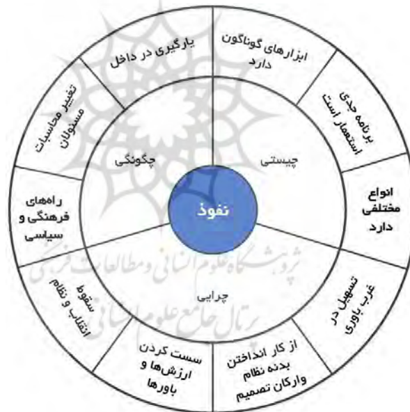
شکل ۱: محورهای اصلی نفوذ در اندیشه مقام معظم رهبری (مدظله العالی)

سیاسی و امنیتی کشور نفوذ کنند (بیانات، ۹۴/۷/۱۵). . . . یکی دیگر از راه‌های ورود و نفوذ، ایجاد خلل در باورها است؛ اختلال در باورهای انقلابی و دینی و رخنه کردن در این‌ها (بیانات، ۹۴/۶/۲۵). . . . از دیگر ابزار نفوذ استکبار، تطمیع و تهدید و فریب است. (بیانات، ۹۰/۸/۱۴). نفوذ میان انقلابیون و تقویت مالی و رسانه‌ای یک جریان نامطمئن و به حاشیه راندن جریان‌های اصیل در انقلاب نیز از دیگر راه‌های نفوذ است (بیانات، ۹۰/۶/۲۶). از سوی دیگر معظم له نظارت و بازرسی از سطوح مختلف اماکن و تاسیسات کشور را به بهانه حصول اطمینان از تعهد ایران به مفاد برجام را نیز یکی دیگر از راه‌های نفوذ دشمن دانسته و می‌فرماید «به‌هیچ‌وجه اجازه داده نشود که به بهانه‌ی نظارت، این‌ها به حریم امنیتی و دفاعی کشور نفوذ کنند؛ مطلقاً. مسئولین نظامی کشور به‌هیچ‌وجه مأذون نیستند که به بهانه‌ی نظارت و بازرسی و مانند این حرف‌ها، بیگانگان را به حریم و حصار امنیتی و دفاعی کشور راه بدهند (بیانات، ۹۴/۱/۲۰). با توجه به سه محوری که در اندیشه امام خامنه‌ای بیان شد می‌توان مهم‌ترین و اساسی‌ترین این سه محور را در نمای زیر مورد توجه قرار داد.