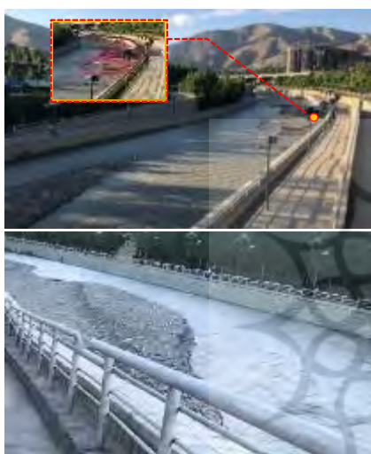
شکل ۶- تجمع رسوبات در محل خمیدگی رودخانه پس از سیلاب فروردین ۱۳۹۸

بنابراین شکل رودخانه از عوامل تأثیرگذار در افزایش یا کاهش سیلاب است. طرح ساماندهی و طراحی مسیر رودخانه‌ی کن در بوستان جوانمردان ایران، برای ایجاد تنوع و زیبایی بصری، دارای پیچ و خم‌هایی است که به دلیل عرض کم رودخانه و افزایش دبی آب به هنگام بارندگی‌های طولانی‌مدت، خود عامل تجمع رسوبات در محل‌های خمیدگی و نقاط تیز است و لزوم لایروبی منظم آن به خوبی مشهود می‌باشد (شکل ۶).