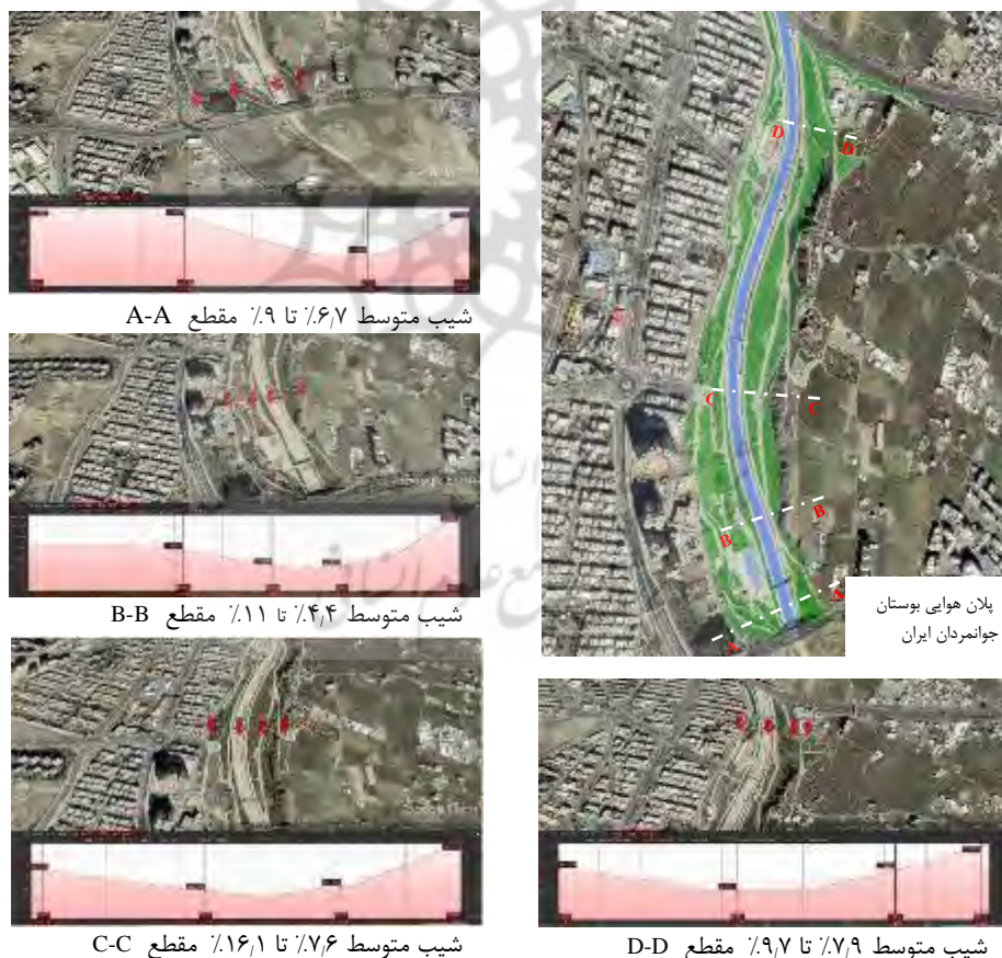
شکل ۱۴- شیب چهار مقطع مختلف از زمین بوستان جوانمردان ایران (Google Earth, 2019)

بنابراین با افزایش شیب زمین، سرعت حرکت آب‌های ناشی از بارندگی افزایش و قدرت جذب آن توسط خاک و سطح زمین کاهش می‌یابد. یکی از مهم‌ترین راه‌حل‌ها، ایجاد تراس‌بندی است. تراس در حفاظت خاک به عملیاتی گفته می‌شود که در آن درجه‌ی شیب تغییر کرده و زمین حالت پلکانی پیدا می‌کند. هدف از این اقدام علاوه بر جلوگیری از