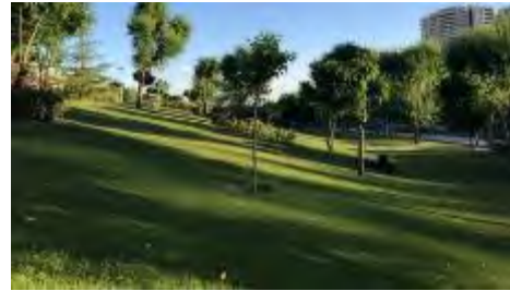
شکل ۱۲- فضاهای سبز شیب‌دار بوستان، بدون در نظر گرفتن تمهیداتی در راستای تأخیر و کاهش سرعت آب‌های سطحی و رواناب به هنگام سیلاب (نگارندگان)

پس از سرریز شدن در پیاده‌راه‌ها و جاده‌ها و کف‌های غیرقابل نفوذ آنها، موجب افزایش رواناب این سطوح می‌گردد و بر شدت جریان سیلاب می‌افزاید (شکل ۱۲).