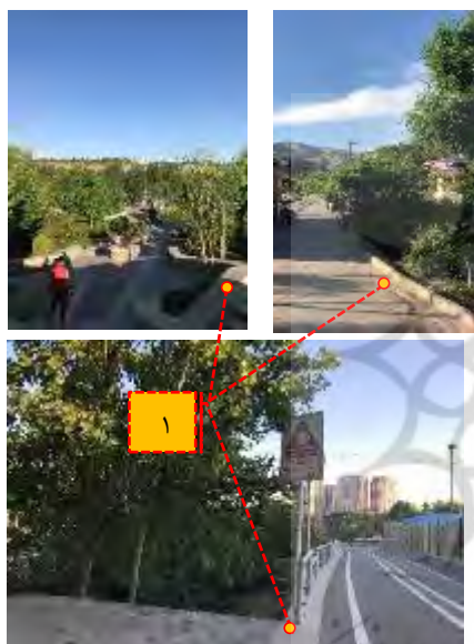
شکل ۱۱- عدم هدایت آب‌های سطحی به فضاهای سبز: (۱) جداسازی فضاهای سبز بوستان جوانمردان ایران از سطح پیاده‌روها با استفاده از جداول و دیواره‌ها (نگارندگان)

۵-۶- فضای سبز و تأخیر و کاهش سرعت آب راهکارهای متنوعی برای شکستن شیب و حفاظت خاک وجود دارد که علاوه بر ایجاد منظر و چشم‌اندازی زیبا، امکان ذخیره‌سازی و قدرت جذب آب در مناطق شیب‌دار را افزایش می‌دهد. فضاهای سبز بوستان جوانمردان ایران در بسیاری از نقاط به صورت سطوح گسترده‌ی یک‌دست شیب‌دار اجرا شده است. از اینرو هنگام بارش باران‌های تند و شدید، آب فرصت کافی برای جذب و پخش شدن در فضاهای سبز کاشته شده در شیب را نداشته، به سمت پایین این فضاها جاری شده و