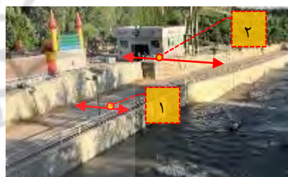
شکل ۵- عدم رعایت حریم رود کن در بوستان جوانمردان ایران: (۱) پیاده‌راه مجاور رود (۲) مبلمان و استقرار کاربری‌های مختلف در حریم رودخانه (نگارندگان)

بر این اساس، ساماندهی رود کن در بوستان جوانمردان ایران بدون در نظر گرفتن حریم قانونی رودخانه و دوره‌های بازگشت چندساله سیلاب انجام گرفته است. طراحی پیاده‌راه سنگ‌فرش شده در مجاورت بستر کانالیزه شده‌ی رودخانه و استقرار برخی کاربری‌ها در محدوده‌ی طغیان سیلاب‌های تاریخی، نمایانگر عدم تأمین ایمنی در برابر خطر سیلاب می‌باشد که از اولویت‌های اصلی و عمده‌ی ساماندهی رودخانه‌ها عنوان شده است (شکل ۵).