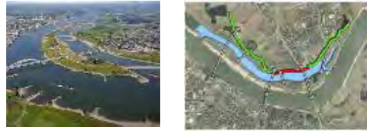
شکل ۱- پیش از مداخله در رودخانه‌ی وال و سازماندهی پس از آن (Muneerodeen, 2017).

یکی دیگر از جاذبه‌های طبیعی نایمخن، جزیره‌ی مصنوعی «Veur-Lent» می‌باشد که در سال ۲۰۱۵ و در ادامه‌ی طرح اصلاح مسیر رودخانه‌ی وال در شمال شهر نایمخن ساخته شده است. این برآمدگی مصنوعی که در میان رودخانه ایجاد شده، با ۳ کیلومتر مربع مساحت، موجب کاهش ارتفاع آب در زمین‌های مجاور تا نیم متر گشته است و ساخت پل‌های ارتباطی به این جزیره، موجب پدید آمدن جاذبه‌های دیدنی در منطقه شده است (Muneerodeen, 2017).