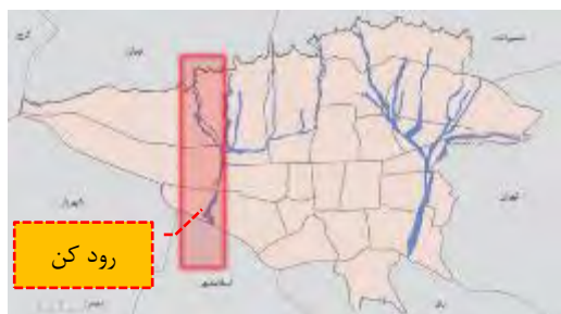
شکل ۲- موقعیت روددره کن بر روی نقشه شهر تهران (Teheran Municipality, 2019)

شبکه‌های دسترسی عمده که روددره کن را در مسیر حرکت آن، از شمالی‌ترین نقطه‌ی تهران تا جنوبی‌ترین نقطه‌ی آن، قطع می‌نمایند (بزرگراه همت، بزرگراه رسالت و آزاد راه تهران-کرج)، طول روددره را به پهنه‌های جدا از هم تقسیم می‌کنند (Daneshpour & Parevar, 2013). این رودخانه در طول تاریخ، دو بار سیلاب قابل توجه همراه با خسارات و تلفات جانی داشته است؛ اولین بار در اردیبهشت سال ۱۳۷۲ خسارات زیادی به ده سولقان، باغات کن و جاده‌ی مخصوص کرج و سایر پل‌های عبوری از روی رودخانه وارد شده (Saberi, 2011) و بار دیگر در خرداد ۱۳۹۴ خسارات جانی و مالی به دنبال داشته است (Alehashemi, Bagheri, & Akhavan, 2015). نیز در پی سیلاب گسترده‌ی کشوری فروردین ۱۳۹۸، این منطقه به‌عنوان محدوده‌ی خطر اعلام و دستور به تخلیه‌ی این بوستان داده شد (Safayi, 2019). پژوهش حاضر سعی دارد تا به بررسی این موقعیت بپردازد.