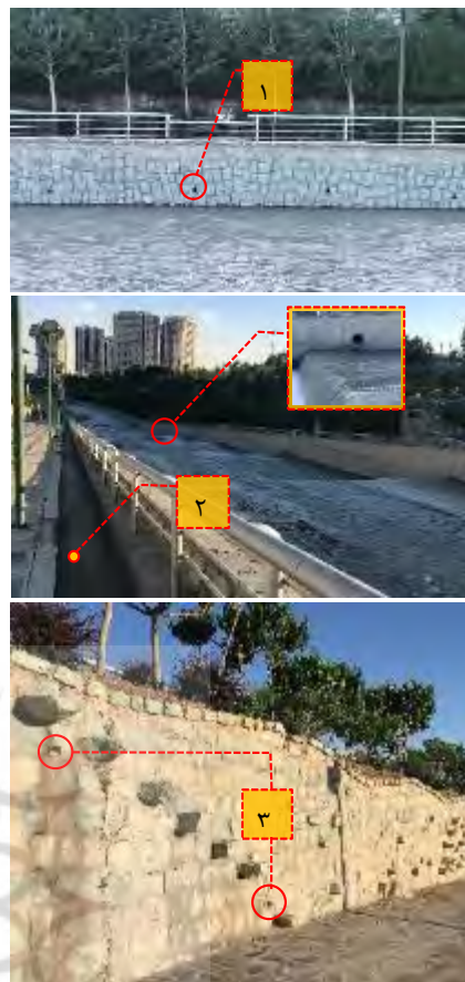
شکل ۹- سیستم زهکشی و هدایت آب: (۱) تخلیه و هدایت آب‌های سطحی بوستان از طریق سیستم زهکشی به رودخانه‌ی کن (۲) جمع‌آوری و هدایت آب پیاده‌رو از طریق جوی (۳) هدایت آب اضافی باغچه‌ها و سطوح بالاتر به پیاده‌روی جنب رود (نگارندگان)

۵-۶- فضای سبز و تأخیر و کاهش سرعت آب راهکارهای متنوعی برای شکستن شیب و حفاظت خاک وجود دارد که علاوه بر ایجاد منظر و چشم‌اندازی زیبا، امکان ذخیره‌سازی و قدرت جذب آب در مناطق شیب‌دار را افزایش می‌دهد. فضاهای سبز بوستان جوانمردان ایران در بسیاری از نقاط به صورت سطوح گسترده‌ی یک‌دست شیب‌دار اجرا شده است. از اینرو هنگام بارش باران‌های تند و شدید، آب فرصت کافی برای جذب و پخش شدن در فضاهای سبز کاشته شده در شیب را نداشته، به سمت پایین این فضاها جاری شده و