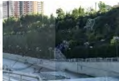
شکل ۱۵- درختکاری انبوه و جنگل‌سازی، راهکاری مؤثر در کنترل سیلاب در بوستان جوانمردان ایران (نگارندگان)

درختکاری‌های بوستان جوانمردان ایران نقش مؤثری در کنترل سیلاب دارند. بدیهی است هرچه تعداد درختان و درختچه‌های کاشته شده در این بوستان افزایش یابد، تأثیر بسزایی در کاهش میزان رواناب در هنگام بارندگی با افزایش زمان تأخیر در جاری شدن آب‌های ناشی از بارندگی بر روی سطح بوستان خواهد داشت (شکل ۱۵).