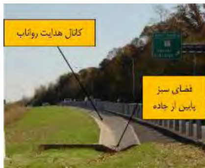
شکل ۱۰- چمن‌ها و سطوح نفوذپذیر در سطحی پایین‌تر از سطوح غیرقابل نفوذ، عامل مهمی در کنترل سیلاب‌های شهری (Davis, James H, Jamil, & Kim, 2012)