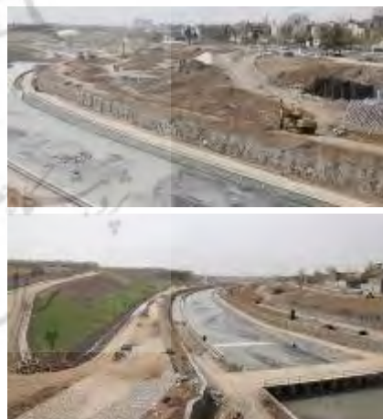
شکل ۷- تخریب ساحل شنی و تبدیل سطوح نفوذپذیر رود

از کل ۶۶ هکتار وسعت بوستان جوانمردان ایران، تنها ۲۰ هکتار آن به فضاهای سبز اختصاص یافته و باقی فضاهای مربوط به کاربری‌های متنوع و گوناگون است (District 22 of Tehran Municipality, 2019). که اغلب دارای کفسازی‌هایی با مصالح نفوذناپذیر می‌باشد. با توجه به سیل‌خیز بودن رود کن، لزوم توجه و حفاظت از سطوح نفوذپذیر در ساماندهی این رودرده از اهمیت بسزایی برخوردار است تا با جذب آب‌های سطحی و کاهش سرعت جریان آب، مانع از افزایش رواناب گردد. علی‌رغم وجود راهکارهای متنوع طراحی منظر در طراحی کف‌های نفوذپذیر، عملیات طراحی و اجرای بوستان جوانمردان ایران با کفسازی‌ها و آسفالت جاده‌ها، سطوح نفوذناپذیر قابل توجهی را ایجاد کرده است (شکل ۷).