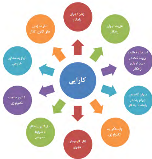
شکل ۲- معیارهای ناظر بر کارایی راهکارها