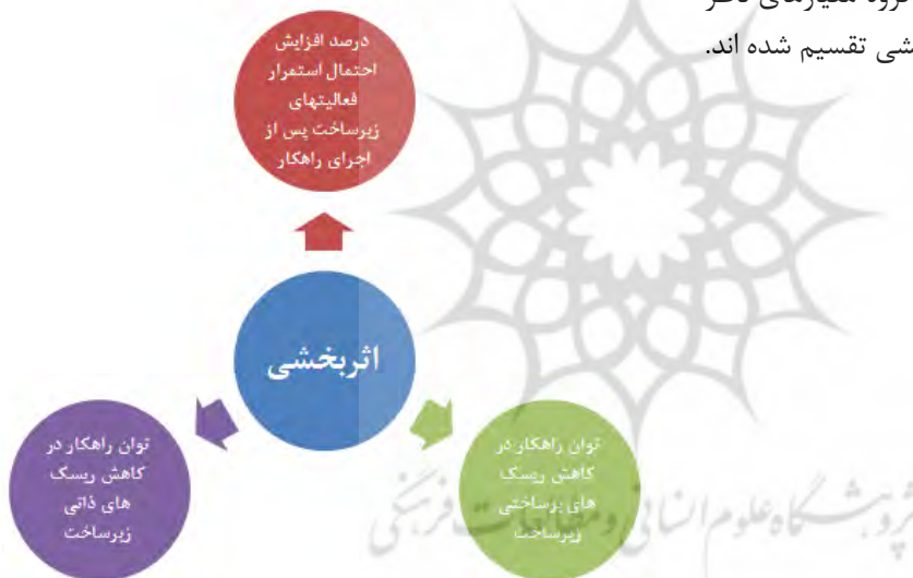
شکل شماره ۳- معیارهای ناظر بر اثر بخشی راهکارها

همانطور که در شکل های شماره ۲ و ۳ ملاحظه می شود معیارهای موثر در ارزشمندی راهکارهای پدافندی با توجه به تعاریف ارائه شده به دو گروه معیارهای ناظر بر کارایی و معیارهای ناظر بر اثر بخشی تقسیم شده اند.