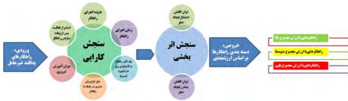
شکل ۴: فرایند مدل مهندسی ارزش برای راهکارهای پدافند غیرعامل