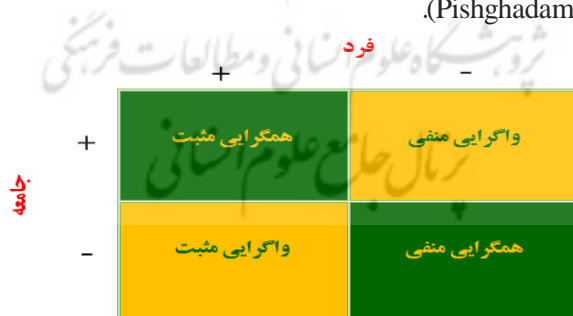
شکل ۱: ابعاد هیجان نخبه‌بینی

همگرایی مثبت زمانی اتفاق می‌افتد که هیجان نخبه‌بینی در دو سطح انفرادی و اجتماعی با یکدیگر همراستا و هر دو نسبت به نخبگان بالاست؛ یعنی افراد و جامعه هر دو برای نخبگان ارزش زیادی قائل هستند و آنان را تکریم کرده و همواره از آنان یاد می‌کنند. در همگرایی منفی این هیجان در هر دو سطح پایین می‌باشد و افراد و جامعه، نخبگان را نادیده می‌گیرند و نسبت به آنان حس خنثی و حتی منفی دارند. واگرایی مثبت هنگامی که هیجان نخبه‌بینی فرد در سطح انفرادی بالا و در سطح اجتماعی پایین است، اتفاق می‌افتد؛ یعنی افراد تمایل زیادی به معاشرت و آشنایی با نخبگان و مشاهیر دارند اما این نخبگان در سطح جامعه انکار می‌شوند و جامعه چندان ارزشی در خور آنان برایشان قائل نیست. واگرایی منفی به موقعیتی اشاره دارد که هیجان نخبه‌بینی در فرد کم و در جامعه بالاست؛ بدان معنا که افراد از دیدن نخبگان هیجان‌زده نمی‌شوند، اما جامعه تلاش می‌کند آنان را به نخبه‌بینی تشویق کند. چکیده این مطالب در شکل ۱ قابل مشاهده است (Pishghadam et al., 2021).