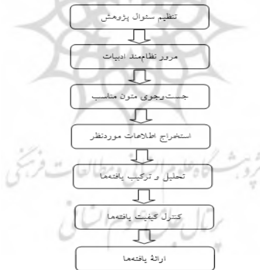
شکل ۱: مراحل انجام روش فراترکیب (سندلوسکی و باروسو، ۲۰۰۷: ۲۰).

هدف این پژوهش بررسی و شناسایی عوامل ناکامی نظام حکمرانی ایالات متحده آمریکا در مدیریت و رهبری بحران همه گیری کووید-۱۹ است. از این رو، مقالاتی که به طور مشخص به این هدف پرداخته اند، شناسایی شده و به روش فراترکیب مورد مطالعه و تحلیل قرار می گیرند. در روش فراترکیب ۱ ، یافته های کیفی پژوهش های مختلف در زمینه موضوع مورد مطالعه به صورت نظام مند مورد بررسی و تحلیل قرار می گیرند. روش فراترکیب با بررسی نقاط قوت و ضعف و آسیب شناسی مطالعات گذشته و شناسایی حوزه های توسعه دانش موردنظر و زمینه های آن، و با بهره گیری از یکپارچگی و مقایسه تفسیرهای مختلف در زمینه موضوع مورد مطالعه، به نظریه پردازی و ارائه تفسیر می پردازد و تفسیری خلاقانه و یکپارچه ایجاد می کند (سندلوسکی و باروسو، ۲۰۰۳: ۱۷۰-۱۵۳؛ سندلوسکی و باروسو، ۲۰۰۷: ۱۸). از این رو، مطالعه حاضر پژوهشی کیفی است. در این پژوهش، از روش فراترکیب هفت مرحله ای سندلوسکی و باروسو (۲۰۰۷) استفاده می شود که در شکل (۱) نشان داده شده است.