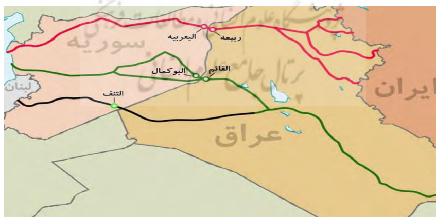
شکل ۱. نقشه گذرگاه‌های منتهی به سوریه

یکی از اهداف ترکیه از توسعه حضور نظامی در منطقه موصل و شمال عراق جلوگیری از ابتکار ارتباطی ایران تا شرق مدیترانه است. در می ۲۰۱۷، شبه‌نظامیان شیعه در مرز سوریه و عراق بین پایگاه التنف آمریکا و شهر بوکمال محل اتصال خود را ایجاد کردند و اولین مسیر مستقیم بین بیروت-تهران را باز کردند و پل زمینی میان ایران-عراق-سوریه تا مدیترانه ایجاد شد. در واقع، پل زمینی ایران یا کریدور ایران که توسط نیروهای ایرانی مستقیماً و توسط نیروهای نیابتی کنترل می‌شد قدرت محور ژئوپلیتیکی را تقویت کرد (Balanche, 2021: 1-5). از نگاه جمهوری اسلامی ایران، پشتیبانی از نیروهای محلی ارزش مسیر موصل-سنجار به مرزهای سوریه را افزایش می‌دهد. گذرگاه مرزی ربیعه از شمال سنجار عبور می‌کند؛ این گذرگاه در نزدیکی منطقه‌ای بود که داعش برای رفت و آمد به سوریه از آن استفاده می‌کرد و هم‌اکنون در کنترل نیروهای حشدالشعبی و ارتش عراق است. سمت سوریه‌ای گذرگاه مزبور در کنترل ارتش آمریکا و شبه‌نظامیان کُرد موسوم به نیروهای دموکراتیک سوریه است. این بدان معناست که دست ایران در این گذرگاه مرزی (برخلاف القائم-بوکمال) چندان باز نیست و در حال حاضر گذرگاه القائم در استان الانبار عراق دروازه ورود ایران به خاک سوریه است (Tasteken, 2021). این در حالی است که ترکیه تا سال ۲۰۱۸ یازده پایگاه موقت نظامی در شمال عراق برپا کرده بود (Yildirim, 2018).