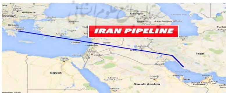
شکل ۲. خط لوله دوستی یا اسلامی (ایران - عراق - سوریه)

خط لوله مزبور می‌تواند جایگاه ایران و کشورهای عراق و سوریه را در سیاست امنیتی و انرژی اروپا تقویت کند. به نظر می‌رسد هدف پنهان ترکیه جلوگیری از عملیاتی شدن این خط لوله است که بخش مهمی از آن از آب‌های سرزمینی ترکیه در مدیترانه به یونان منتقل خواهد شد. در راستای سیاست‌های خصمانه آمریکا علیه ایران، عملیات اجرایی خط لوله مزبور با افزایش ناآرامی‌ها و ظهور داعش در سوریه در سال ۲۰۱۱ و سرایت بحران به عراق در سال ۲۰۱۴ عملاً متوقف شد. البته در مقابل، آمریکا از خط لوله ترکیه-قطر که می‌تواند خط لوله ترانس آدریاتیک نیز را تقویت کند حمایت کرده است. کما اینکه خط لوله اسلامی می‌تواند تهدیدی یا جایگزینی برای خط لوله قطر-ترکیه باشد که توسط قطر پیشنهاد شده تا گاز قطر را از طریق عربستان، اردن و سوریه به ترکیه و در نهایت به اروپا برساند.