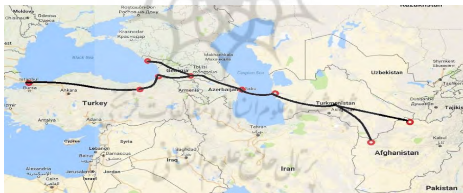
شکل ۳. کریدور لاجورد اتصال ترکیه به قفقاز-ماورای خزر (آسیای مرکزی) و افغانستان بدون عبور از ژئوپلیتیک ایران