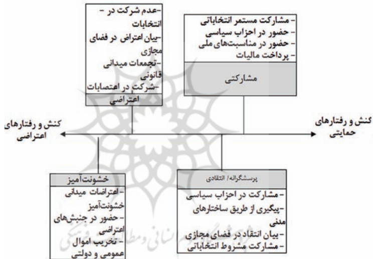
شکل ۲- طیف‌بندی سنخ‌شناسی سوم کنشگری سیاسی

همچنین از دیدگاه آبرامسون، صورت‌های نامتعارف و اعتراض‌آمیز مشارکت، به عنوان سومین شاخص، خود به دو شکل قانونی و غیرقانونی تقسیم می‌شوند. شکل‌های قانونی عبارتند از گردآوری دادخواست یا طومار، شرکت در تظاهرات مجاز، کارشکنی و تحریم فروشگاه‌ها یا محصولات، شرکت در اعتصابات و شکل‌های غیرقانونی نیز عبارتند از خشونت در برابر اشخاص و آسیب‌رساندن به اموال و املاک. (لیپست، ۱۳۸۳: ۵۵۳) مجموعه‌ی شاخص‌های مورد اشاره مولد گونه‌های مختلفی از کنشگری به شرح زیر خواهد بود: