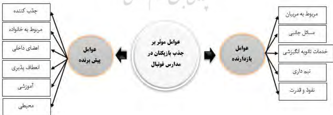
شکل ۱. مدل مفهومی برخواسته از یافته های کیفی

جهت اختصار در ارائه یافته های مقاله، از بیان بار عاملی هر سوال در هر مولفه چشم پوشی شد و با توجه به یافته های تحلیل عاملی اکتشافی و مسئله اصلی تحقیق، مدل مفهومی به شرح شکل ۱ رسم شد.