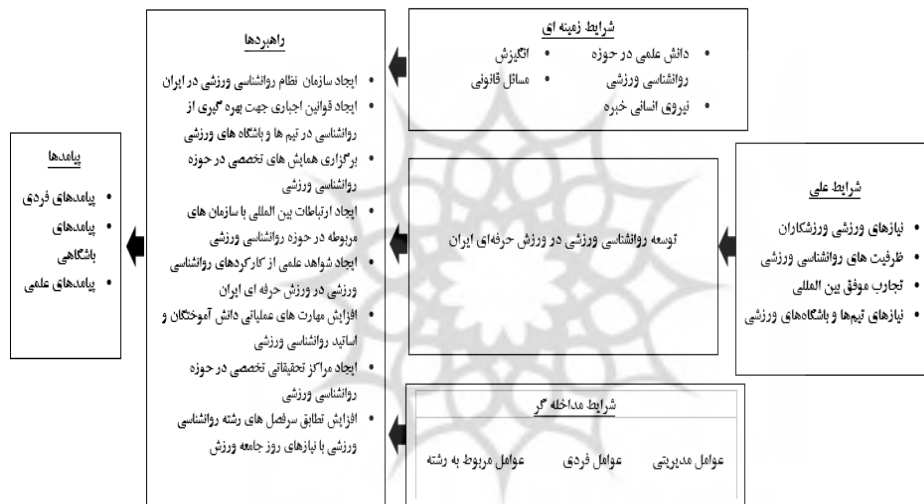
شکل ۱- الگوی مفهومی پژوهش (خروجی بخش کیفی) (The conceptual model of the research (output of the qualitative section))

پژوهش غیرطبیعی بود. از طرفی با توجه به حجم نمونه پژوهش و غیرطبیعی بودن توزیع داده‌ها مشخص شد که برای تحلیل داده‌ها از نرم‌افزارهای واریانس‌محور و نرم‌افزار پی‌ال‌اس‌اس باید استفاده شود. به‌منظور شناسایی مؤلفه‌ها و ابعاد الگوی توسعه روان‌شناسی ورزشی در ورزش حرفه‌ای ایران از بررسی نظرات خبرگان در قالب روش کیفی استفاده شد. پس