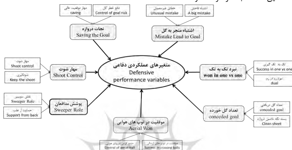
شکل ۱- مدل استخراجی متغیرهای عملکردی دفاعی دروازه‌بان

صورت گرفت تا مفاهیمی که با هدف محقق در یک راستا بود و بهره‌گیری از آن‌ها نتایج ثمربخش‌تری در فرایند تحقیق داشت، به کار گرفته شود.