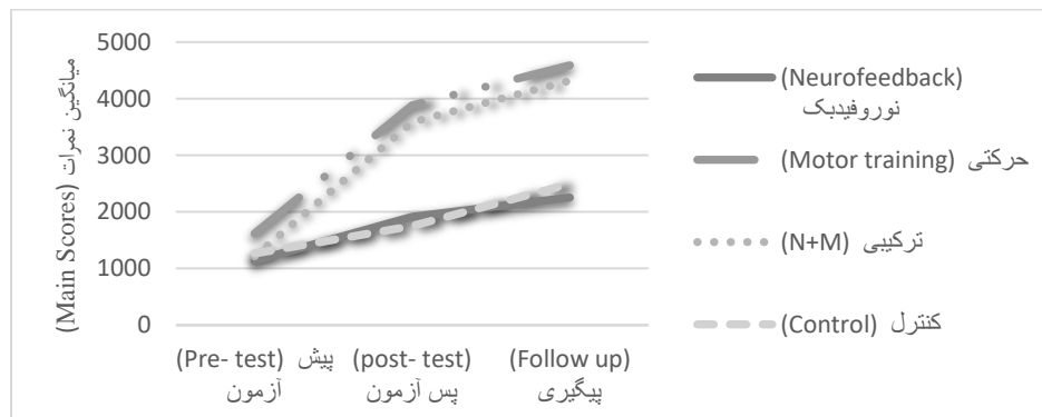
شکل ۲- نمودار زمان باقی ماندن بر هدف گروه‌ها در مراحل پیش‌آزمون، اکتساب و یادداری