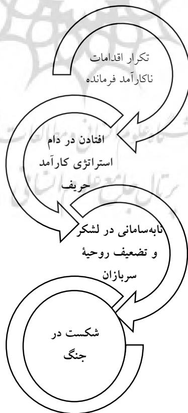
نمودار ۲. عوامل اساسی ناکامی امیر مسعود سربداری در نبرد مازندران

لشکریان امیر مسعود در واپسین لحظات حیاتشان آن‌چنان بی‌توشه و سرگردان بودند و وضعیت روحی و جسمی آن‌ها چنان دگرگون شده بود که کودکان و پیران مازندرانی قادر بودند فرماندهان و پهلوانان آن‌ها را اسیر کنند. امیر مسعود بعد از دو روز از ترک آمل، شب‌هنگام به دست نیروهای ملک شرف‌الدوله در حالی که در کوهستان سرگردان شده بود اسیر شد و سرانجام