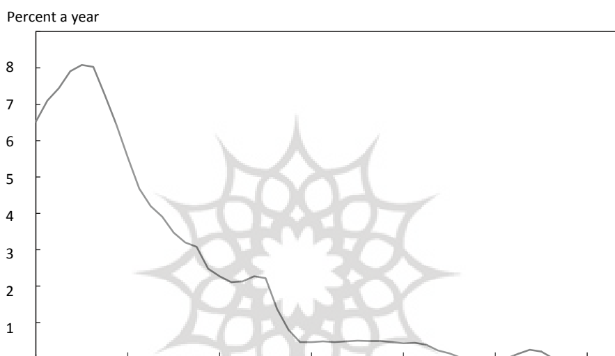
شکل ۱. ژاپن: نرخ وام های یک شبه و نسبت پایه پولی به تولید ناخالص داخلی، ۱۹۹۰-۲۰۰۲