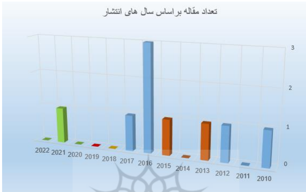
شکل ۲. روند انتشار مقالات.

در مرحله بعد، یک دیدگاه طولی در رابطه با تکامل مضامین مقالات شامل نمونه ارائه شده است (شکل ۲ را ببینید).