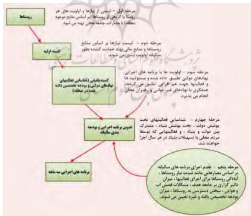
شکل (۳): فرآیند تدوین برنامه اجرایی و بودجه‌بندی سالیانه و نقش مشارکتی ذی‌نفعان

به منظور برون‌رفت شهرستان مذکور از مسائل و مشکلات مطرح شده، مهندسین مشاور سبزاندیش پایش به عنوان مشاور مطالعاتی طرح آبادانی و پیشرفت با اطلاعات منتج از شناخت و تحلیل وضعیت موجود در مجموع ۱۲۶ طرح و برنامه اجرایی در چهار بخش متولی اجرا؛ جامعه محلی، ارگان‌های دولتی، بنیاد علوی و بنیاد علوی به نیابت از دولت پیشنهاد نمودند. فرایند تدوین این برنامه اجرایی و بودجه‌بندی سالیانه و همچنین نقش مشارکتی ذی‌نفعان به صورت شماتیک در شکل (۳) آورده شده است.