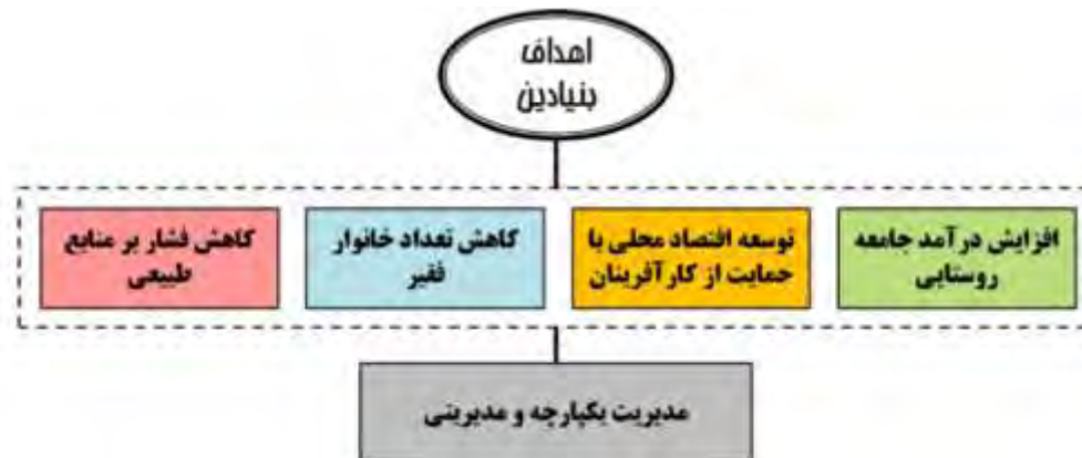
شکل (۲): اهداف بنیادین مطالعات آبادانی و پیشرفت شهرستان قلعه گنج

غیرکشاورزی که از مولفه‌های اصلی اقتصاد مقاومتی هستند، همچنین بهره‌برداری پایدار از منابع طبیعی در تدوین اهداف مورد نظر بوده است. این اهداف در چارچوب مدیریت کارآمد و مشارکتی قابل حصول است.