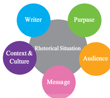
شکل ۱. موقعیت رتوریکال. منبع (Last.2019)

پرسش‌ها پاسخ داد: "چه کسی با چه کسی، درباره چه موضوعی، چگونه و برای چه منظوری سخن می‌گوید." (Last.2019) و لذا ارکان موقعیت رتوریکال را این چنین نشان می‌دهد.