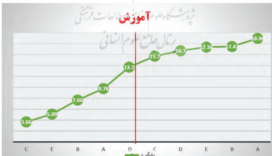
نمودار ۲: پیشرفت یادگیری