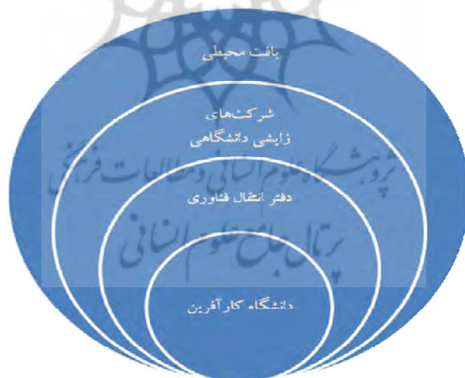
شکل ۱: ارتباط تحقیقات انجام شده درباره دانشگاه کارآفرین [۴]

تعاریف گسترده و متعددی از کارآفرینی و دانشگاه کارآفرین ارائه شده است. روتارمل ۱ و دیگران در تحقیق جامع خود در موضوع ارتباط صنعت و دانشگاه، تحقیقات مربوط به این بحث را به چهار بخش طبقه بندی کرده اند؛ ماهیت دانشگاه کارآفرین، دفاتر انتقال فناوری، شرکتهای دانشگاهی، بافت محیط پیرامونی دانشگاه. تحقیقات موجود یا به موضوعات این چهار بخش و یا به ارتباط دوهی اینها با یکدیگر پرداخته اند [۴].