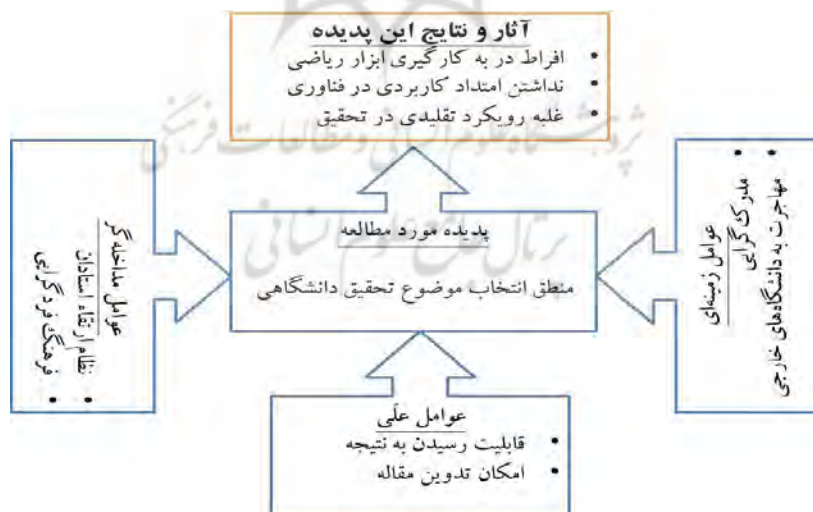
شکل ۱: مدل پارادایمی منطق انتخاب موضوع تحقیق دانشگاهی

مرحله بعدی مربوط به کدگذاری انتخابی است. کدگذاری انتخابی فرایند یکپارچه‌سازی و پالایش مقوله‌ها است به این ترتیب که محقق با ایجاد آهنگ و چیدمانی خاص بین مقوله‌ها آنها را برای ارائه و شکل‌دهی یک تئوری تصویر تنظیم می‌کند.